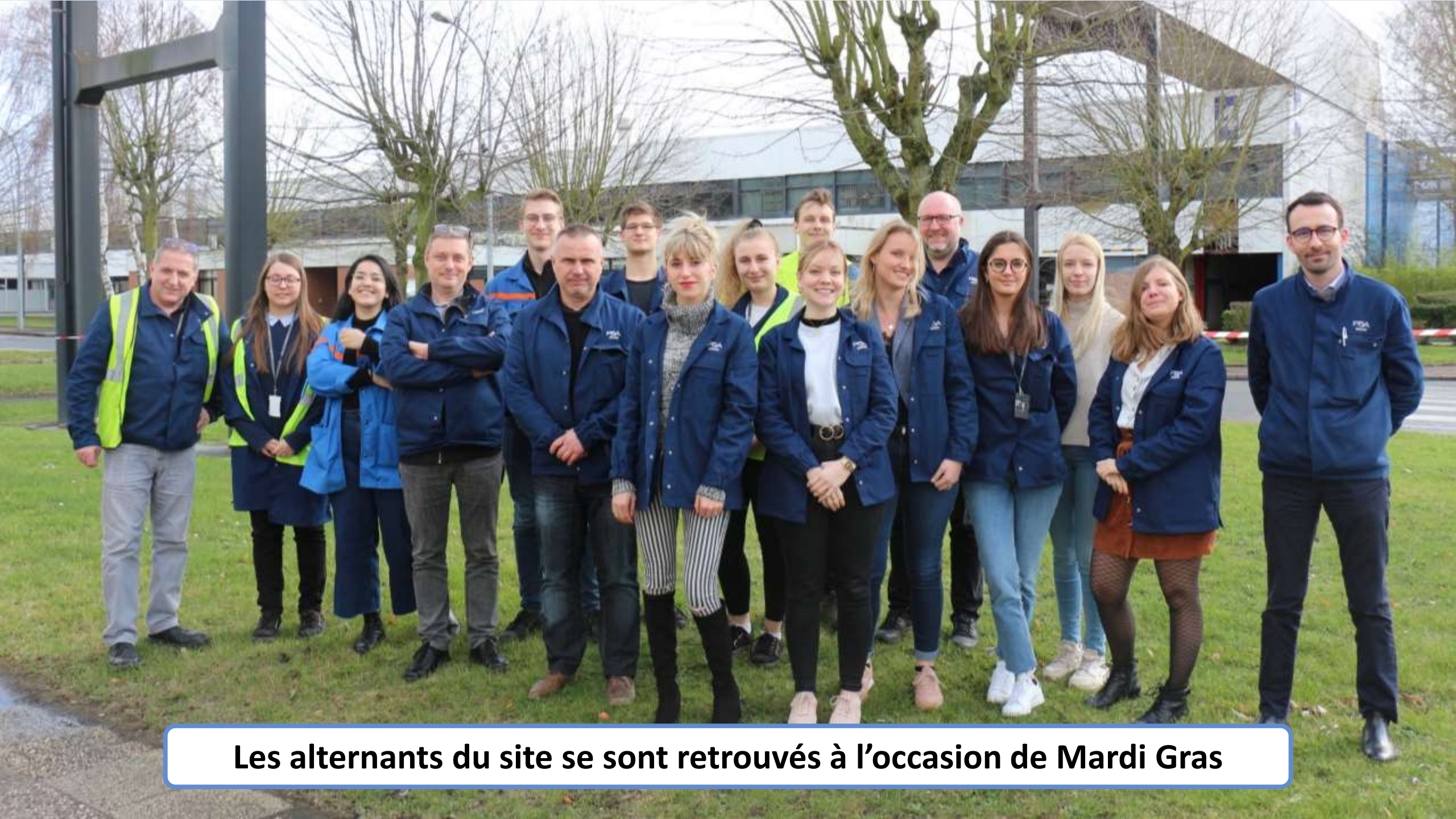
Les alternants du site se sont retrouvés à l'occasion de Mardi Gras