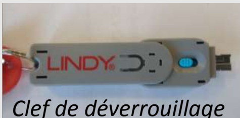
Clef de déverrouillage

Il est formellement interdit aux personnes non autorisées de retirer les bloqueurs et de se connecter sur un des ports USB des PC industriels