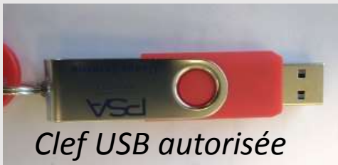
Clef USB autorisée