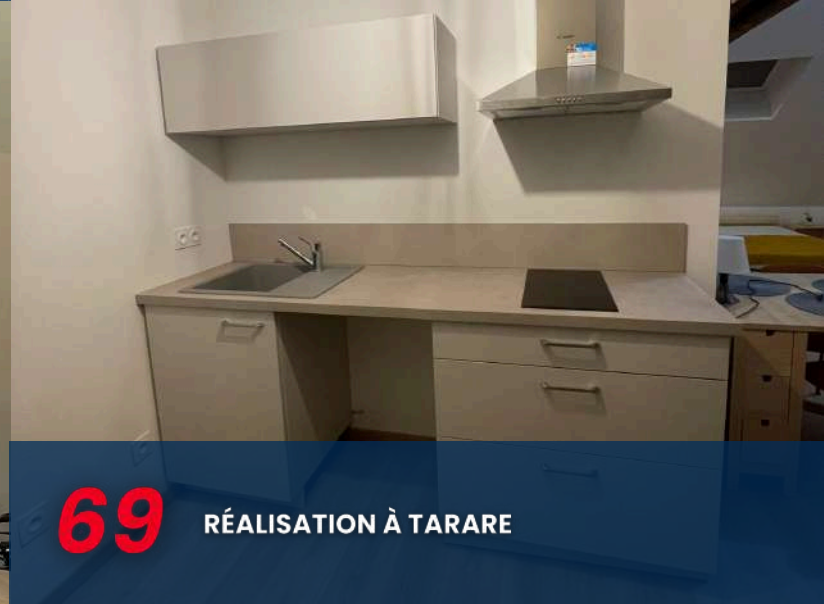
69 RÉALISATION À TARARE