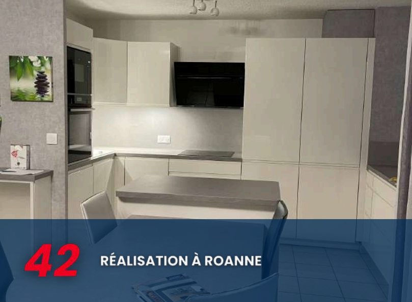
42 RÉALISATION À ROANNE