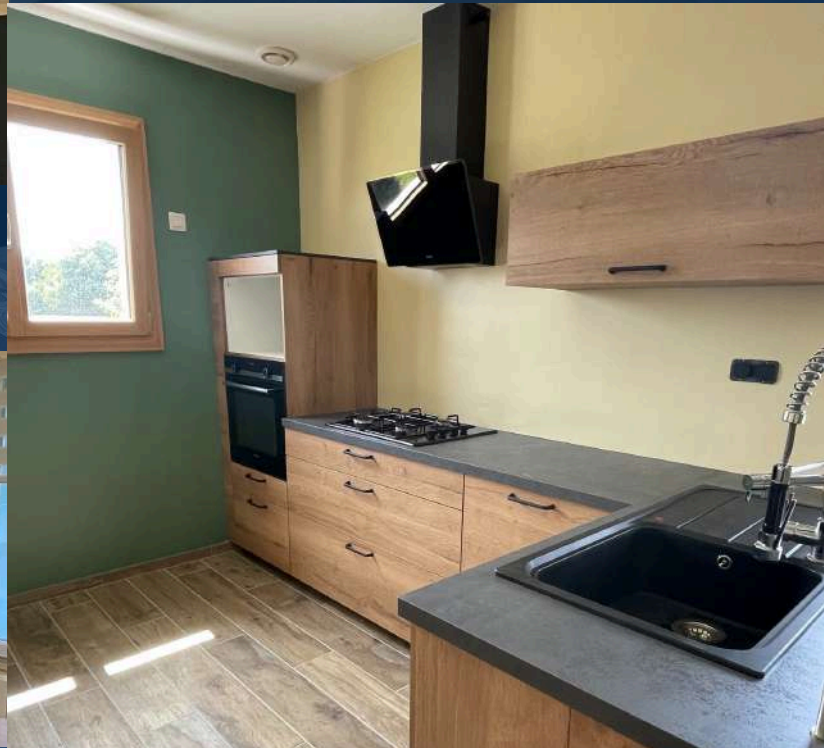
42 RÉALISATION À LE COTEAU