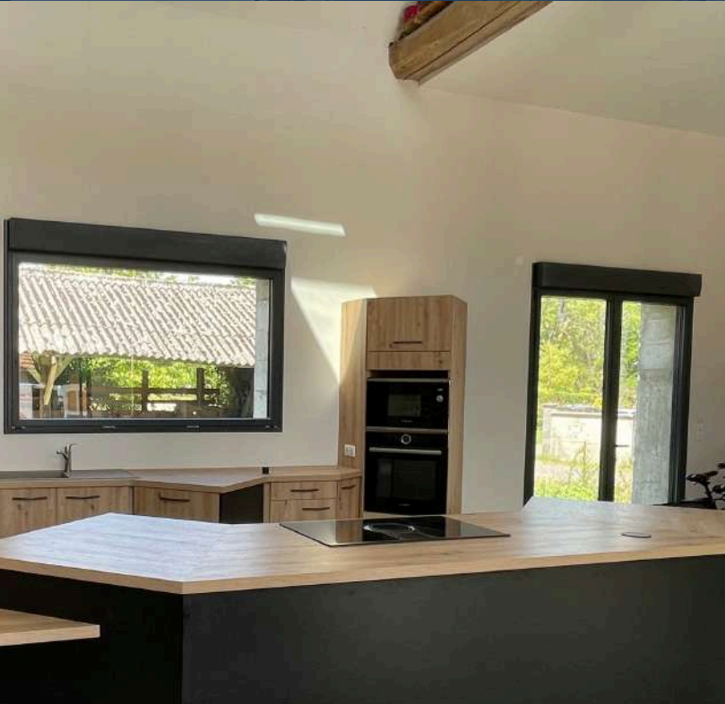
42 RÉALISATION À MABLY