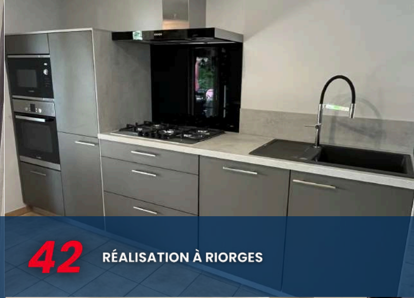
42 RÉALISATION À RIORGES