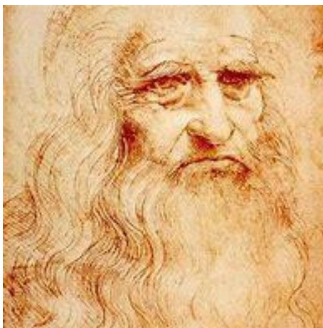
Autoportrait de Léonard de Vinci

Retrouvez toutes les bibliographies sur :