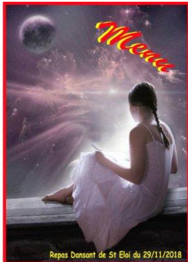
Repas Dansant de St Eloi du 29/11/2018