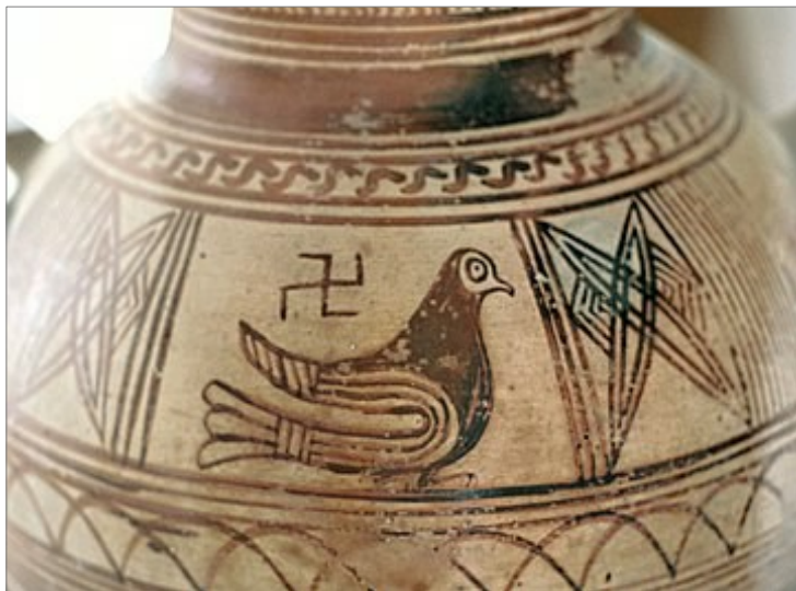
Oiseau et Svastika Amphore datant du VII- VII Siècle av JC

Les premières représentations de ce symbole ont été retrouvées en Ukraine vers 10 000 av. J.-C, puis dans la culture de Vinča en Serbie, en Grèce, en Mésopotamie et en Élam, et datées de 5 500 à 2 500 ans av. J.-C.2.