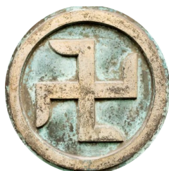
Enroulement des branches vers la gauche

Le Svastika , interprétation de la roue solaire Il représente le soleil et l'orientation de ses branches lui donne un élan, une certaine vitesse, c'est donc une représentation du cycle du soleil et de la vie et n'a rien à voir avec celle du nazisme.