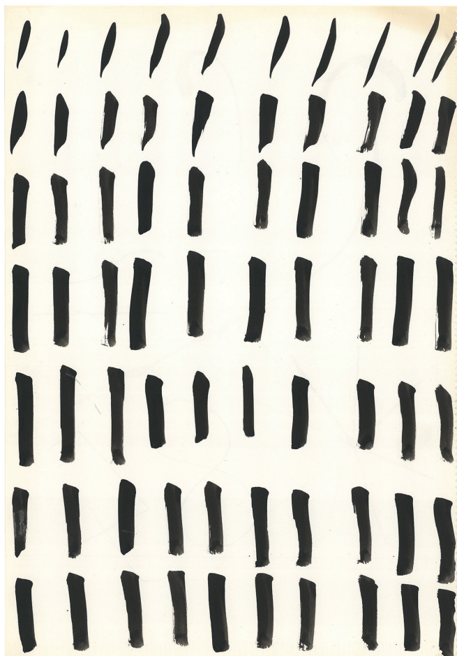
ramo n losa. sans titre, c. 2020. gouache sur papier, 49,5 x 34,4 cm.

du 9 février au 19 mars 2023 vernissage le jeudi 9 de 18h à 21h