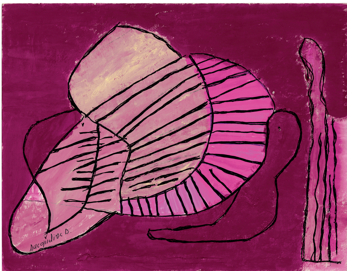
sans titre, 1970 gouache sur papier, 23.9 x 32 cm