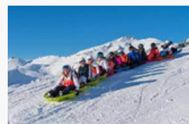
Le snake gliss

Et coup de cœur également pour le Bobsleigh (les fans du film Rasta Rockett se reconnaîtront !) proposé à La Plagne , par exemple, à vous les sensations fortes avec une descente à plus de 100 km/h !