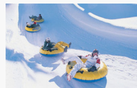
Le Snow Tubing