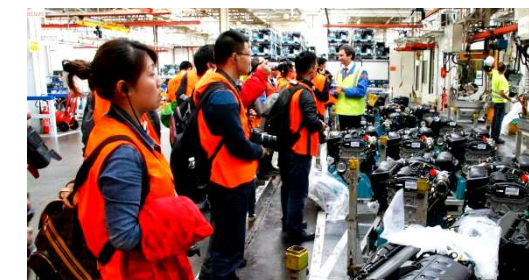
Un groupe de journalistes chinois a visité les installations de production du moteur EP

Le 25 septembre, un groupe de journalistes chinois a visité nos installations. Dans le cadre du lancement prochain en Chine de la nouvelle C4L, ces journalistes ont été