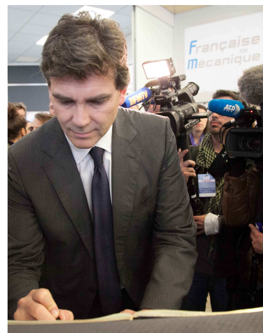
▲ Livre d'Or, M. Montebourg a laissé un message à l'attention de tous les salariés.

Livre d'Or Arnaud MONTEBOURG, Ministre du Redressement Productif 8 octobre 2012