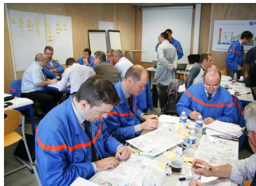
La refonte du Tour de Terrain et de la RPO était au cœur de ce chantier organisé sur le secteur de l'usinage EP

Un chantier « Management Control, » organisé en semaine 42 à FM, a réuni une trentaine de membres des secteurs de Production, Maintenance de l'Usinage du Moteur EP, ainsi que des métiers supports : PTSI, QUP et RH. Des représentants des sites de Trémery, Valenciennes et Metz étaient également présents pour ce chantier pilote pour la DMB, animé par le « Métier PES Central ».