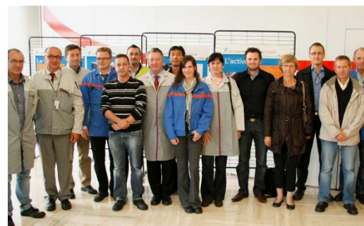
Le groupe de travail « réseau 14 » à FM

techniques de FM participent activement à ce groupe de travail.