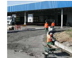
Travaux de réaménagement au bâtiment A20

ballages vides dans l'entreprise. Par la même occasion, la gestion et le retour des Gefbox se trouveront simplifiés. Pour rappel, l'utilisation de ces Gefbox en dehors de leur circuit logistique, occasionne pour FM des coûts non négligeables.