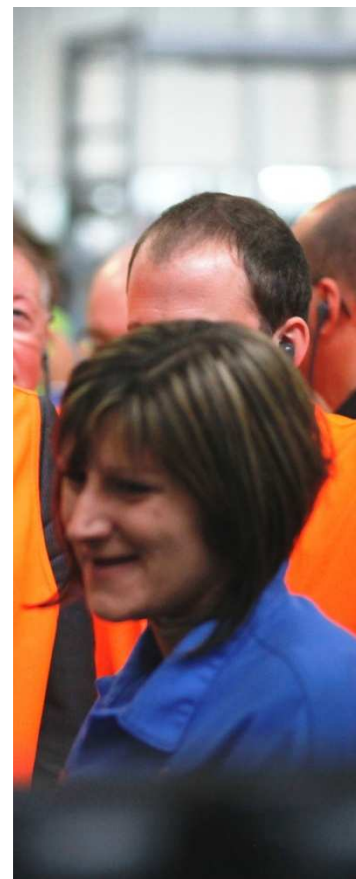
mes et ces femmes sur le terrain, se fabrique l'avenir de l'automobile