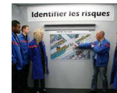
Les alternants à la Safety Box

La Sécurité est notre première exigence. Voici le message important qu'entendent les alternants dès le premier jour. Ils l'auront bien compris, on ne plaisante pas avec la sécurité. Ils sont aujourd'hui 185 alternants à être passés par la "Safety Box". Un espace de formation qui forge tous les salariés à la sécurité, l'objectif étant d'atteindre le « zéro accident ». L'alternant est donc prévenu : il n'est pas censé ignorer les règles de sécurité ! A