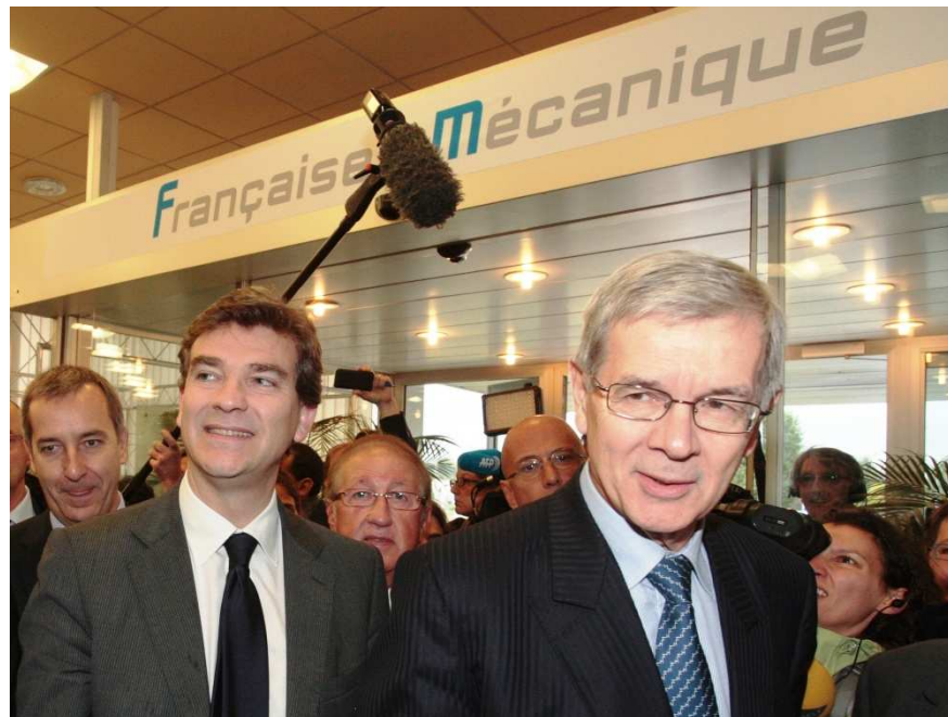
▲ Hall d'accueil Philippe Varin, Président du Directoire PSA, reçoit sur notre site Arnaud Montebourg, Ministre du Redressement Productif.