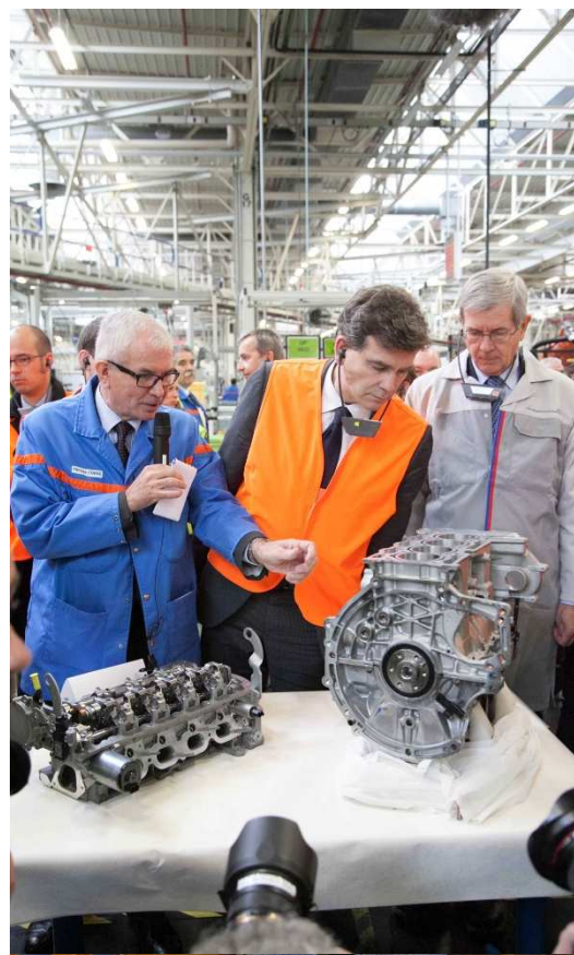
▲ Moteur EP M. Montebourg à la rencontre et à l'écoute des salariés.

▲ « Ce que je suis venu voir aujourd'hui, ce sont tous ces hommes dans le Nord Pas de Calais, la première région automobile où s'écrit le mot "bible." » a déclaré M. Montebourg.