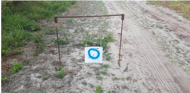
Cible du TLD 30 x 30

2mns de préparation, 7mns de tir pour 24 cartouches = 88 points