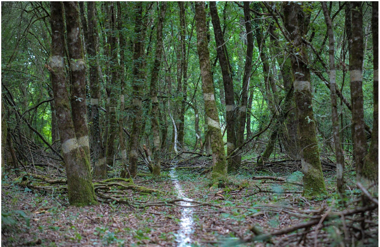
Lieu d’un voyage poétique, à Chassy, Festival Marelle s’emballe 2021.

Tout lieu proposant un chemin, et même des monotraces, serait idéal pour accueillir notre voyage poétique et sensoriel qui trouverait dans cette disposition en ligne droite son espace scénique rêvé. Le voyage est alors vécu comme une traversée, où l’être se trouverait lavé de toute fioriture moderne, se retrouverait confronté à ses seules ressources sensibles.