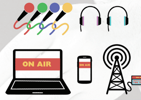
Diffusion via un ordinateur ou un téléphone portable ou un émetteur FM