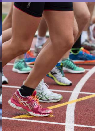
COURSE À PIEDS