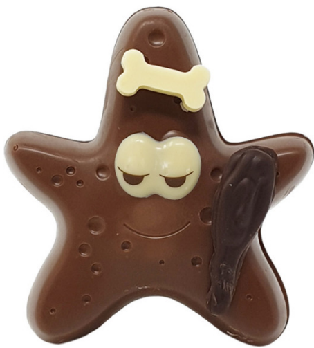
Étoile de mer

A l'occasion des fêtes de Pâques il nous est impossible de nous soustraire à une tradition bien établie où les œufs, les poules, les lapins et autres délicieux sujets font la joie des enfants.