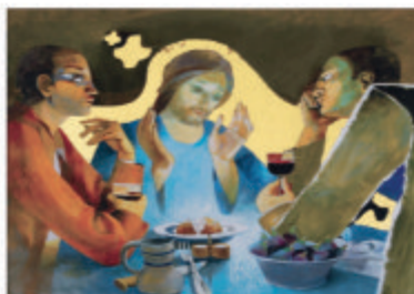
Ci-dessus : La table d'Emmaüs par Arcobas Ière page : Marie et Elisabeth par Arcobas

Il est possible de participer à l'ensemble de la proposition ou à l'une ou l'autre partie seulement.