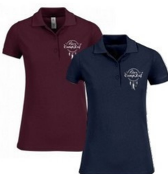
Polo Adulte Femme 25 euros