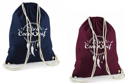
Sacs à bombe 17 euros

Quantité : ____ Prénom : _____ Date de naissance : _____