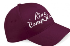
Casquettes 12 euros