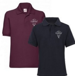
Polo Adulte Homme 25 euros

Bleu Quantité : ____ Bordeaux Quantité : ____