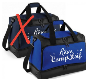
Sac d'écurie 59.90 euros

Bleu Quantité : ____ : Taille(s) : ____ Bordeaux Quantité : ____ Taille(s) : ____