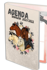
Agenda Scolaire 5 euros

Quantité : ____ Dédicace: _____ (Prénom)