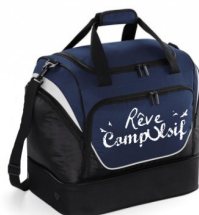
Sac de pannage 54.90 euros

Bleu Marine Quantité : ____ Bleu roi Quantité : ____