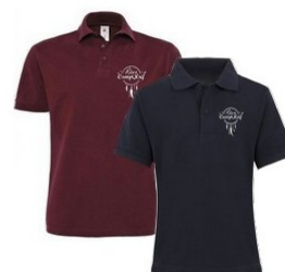
Polo Enfant 23 euros