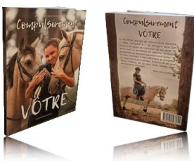
Livre Compulsivement Vôtre 15 euros

Quantité : ____ Dédicace: _____ (Prénom)