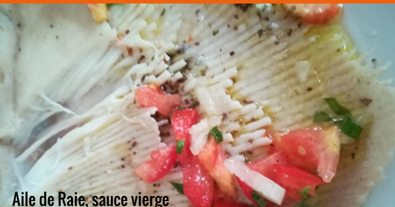
Aile de Raie, sauce vierge