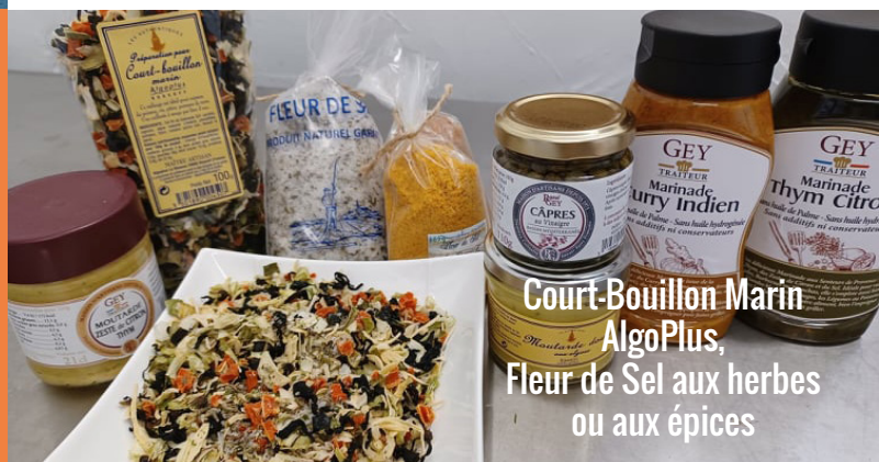
Court-Bouillon Marin AlgoPlus, Fleur de Sel aux herbes ou aux épices