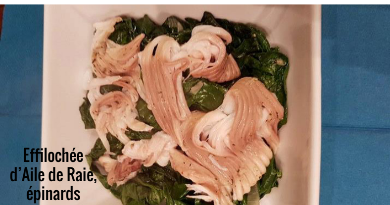
Effilochée d'Aile de Raie, épinards

La Chair en lamelles s'altère très rapidement,