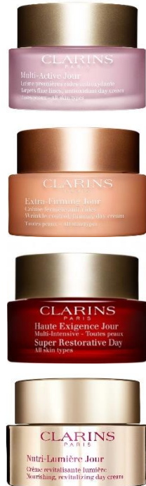
Crème Jour au choix