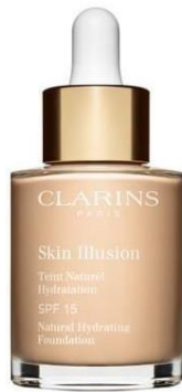
Fond de teint fluide au choix

Baume Beauté Eclair + Fond de Teint fluide