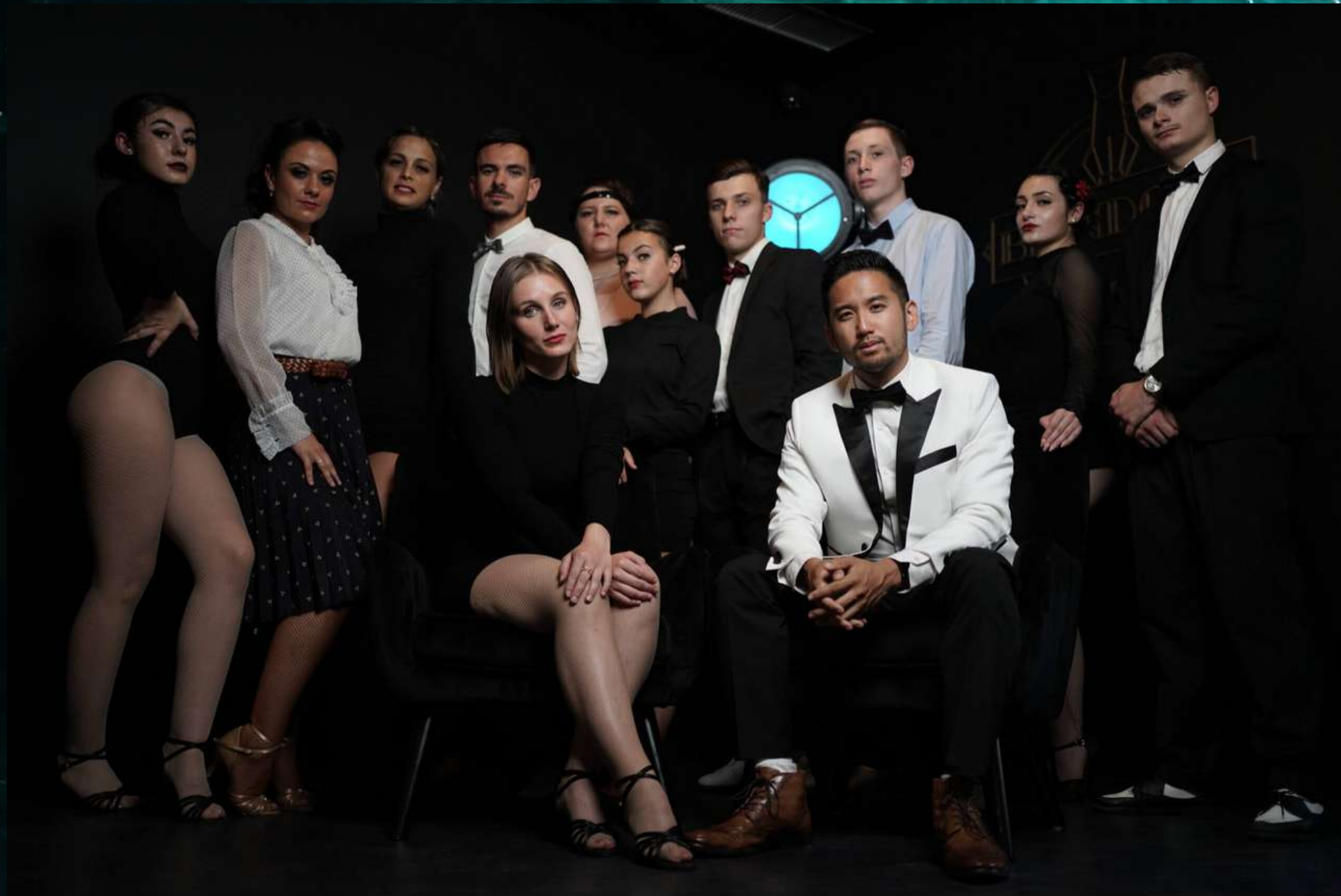
Dance Concept Cie