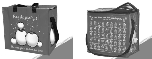
Dimensions : L. 35 x H. 33 cm - Soufflet : 20 cm

ILS SERONT ILLUSTRÉS GRÂCE À LA RÉALISATION DES DESSINS DE VOS ENFANTS !