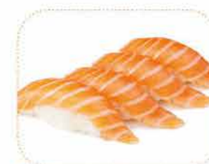
B 4 sushi saumon