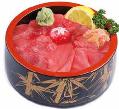
MENU C2 14.80€ CHIRASHI THON Tranches de thon cru sur un grand bol de riz vinaigré