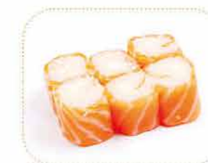
H 6 saumon roll cheese