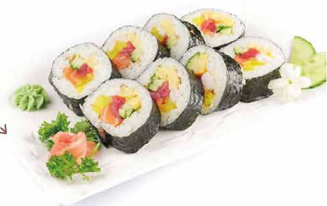
CALIFORNIA DRAGON POULET PANÉ 13.80€ (10 PIÈCES)

25 california dragon poulet pané (masago, poulet pané, concombre, avocat, cheese, salade, oignons frits)