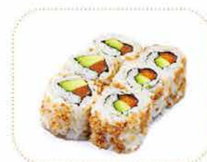
J 6 california oignons frits saumon avocat ou thon cuit avocat