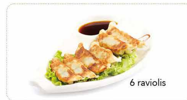
MENU B1 13,80€ 6 maki saumon, *6 raviolis ou 5 brochettes: 2 poulet, 2 boeuf au fromage, 1 boulette de poulet