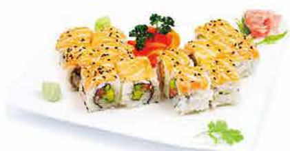
MENU M1 14.50€ 12 las vegas roll, (saumon avocat, thon avocat)