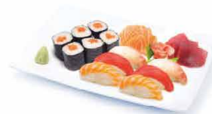
MENU K7 18.00€ 6 maki saumon, 6 sushi (3 saumon, 3 thon) 6 sashimi (3 saumon, 3 thon) + riz