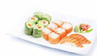
MENU K9 16.80€ 2 sushi saumon, 6 saumon roll cheese, 6 printemps roll saumon