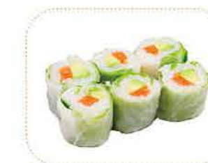
I 6 printemps saumon avocat ou thon cuit