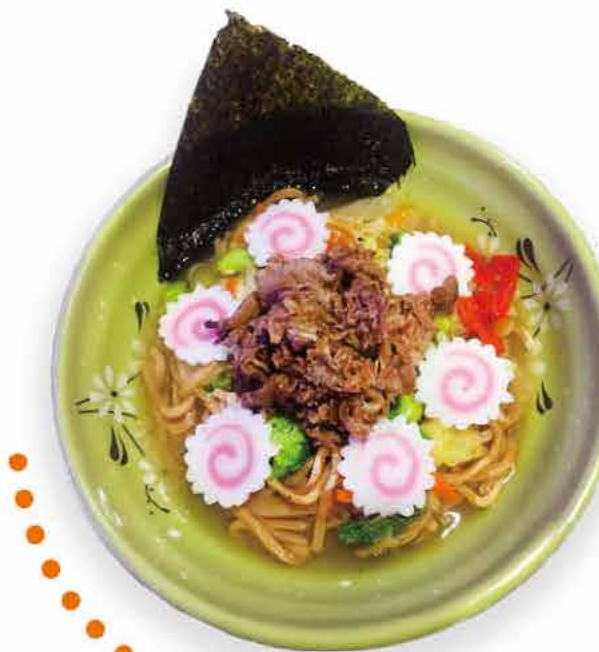
C6 17.90€ Ramen nouilles au bœuf et aux légumes