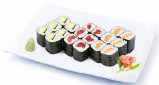
MENU K1 11.80€ 6 maki saumon, 6 maki thon, 6 maki concombre