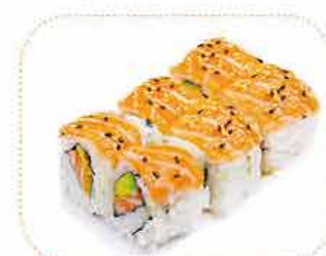
A california las vegas saumon ou surimi