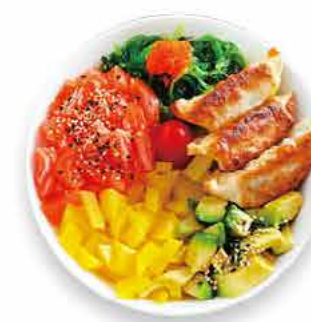
GP1 14.50€ Gyoza Poké Tartare saumon 3 Gyoza (raviolis grillés au poulet), tartare saumon, tomate, radis marinés, avocat, salade d'algue et sésames sur un bol de riz vinaigré