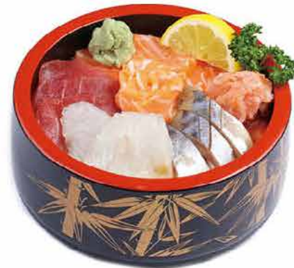
MENU C3 15.20€ CHIRASHI ASSORTIMENT Tranches de sashimi assortiment cru sur un grand bol de riz vinaigré