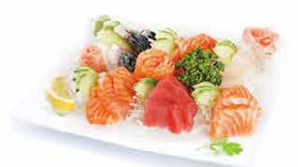
MENU M6 16.90€ 20 sashimi assortiment (8 saumon, 4 thon, 4 daurade, 4 maquereau) + riz