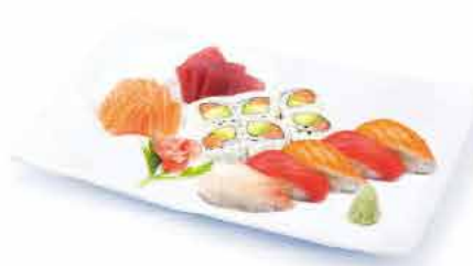
MENU M5 17.90€ 5 sushi assortis, 6 california saumon avocat, 6 sashimi (3 saumon, 3 thon) + riz