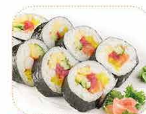
F 6 Futo maki (saumon, thon, surimi, avocat concombre)