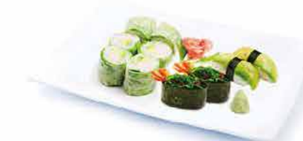
MENU V2 14.50€ 6 printemps roll cheese avocat, 2 sushi avocat, 2 sushi d'algue