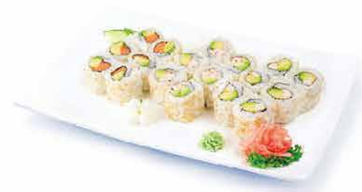
MENU K3 14.80€ 6 california saumon avocat, 6 california thon cuit avocat, 6 california surimi avocat