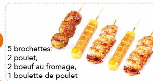
MENU B2 14,00€ 4 sushi assortis, *6 raviolis ou 5 brochettes: 2 poulet, 2 boeuf au fromage, 1 boulette de poulet