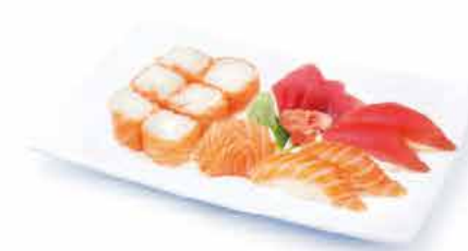
MENU K8 18.80€ 6 saumon roll cheese, 6 sashimi (3 saumon, 3 thon) 4 sushi (2 saumon cheese, 2 thon cheese) + riz