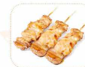
L1 3 brochette de poulet