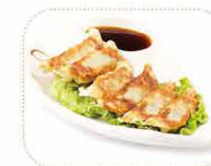
L Gyoza (6 pièces)