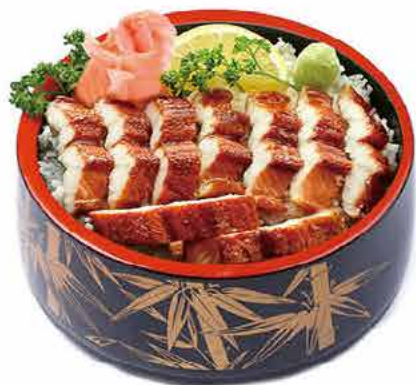
MENU C4 17.80€ CHIRASHI ANGUILE Anguille grillé sur un grand bol de riz nature