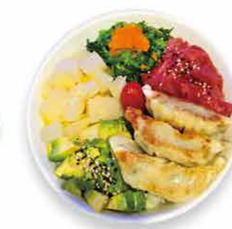
GP3 15.50€ Gyoza Poké Tartare thon 3 Gyoza (raviolis grillés au poulet), tartare thon, tomate, radis marinés, salade d'algue, avocat et sésames sur un bol de riz vinaigré