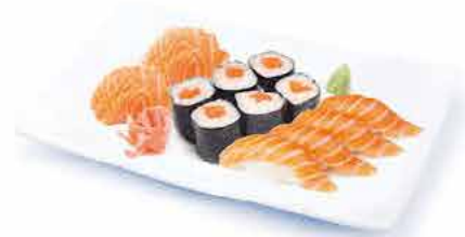
MENU M3 15.80€ 4 sushi saumon, 6 maki saumon 6 sashimi saumon + riz