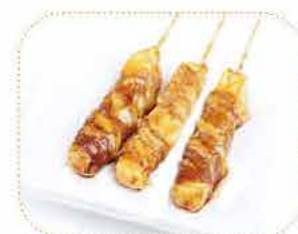
E 3 boeuf fromage