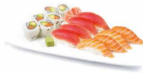
MENU K4 16.50€ 6 california saumon avocat, 8 sushi (4 saumon, 4 thon)