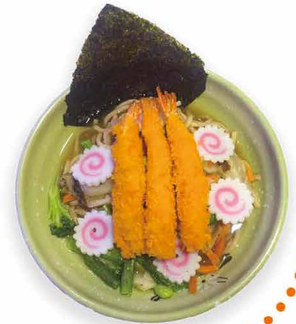
C7 18.90€ Ramen nouilles aux tempura crevettes et légumes