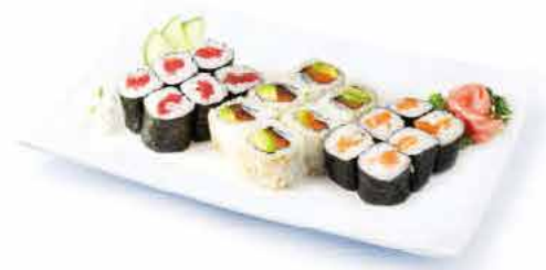
MENU K2 13.80€ 6 maki saumon, 6 maki thon, 6 california saumon avocat