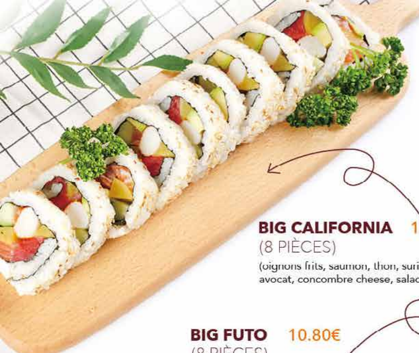
BIG CALIFORNIA 11.80€ (8 PIÈCES) (oignons frits, saumon, thon, surimi, avocat, concombre cheese, salade)