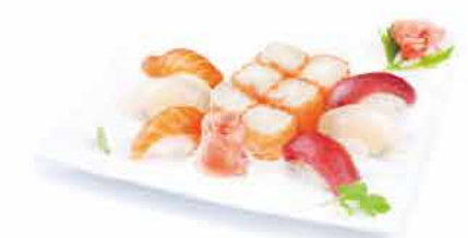
MENU M8 17,00€ 6 sushi (2 thon, 2 saumon, 2 daurade), 6 saumon roll cheese