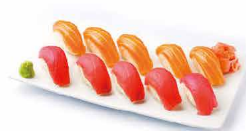
MENU K6 16.80€ 10 sushi duo (5 saumon, 5 thon)