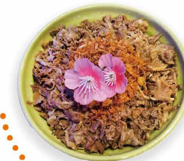
C8 18.90€ Chirashi bœuf sautés aux oignons frits sur une bol de riz

Prix net TTC. Menu boisson non comprise. Photos non contractuelles