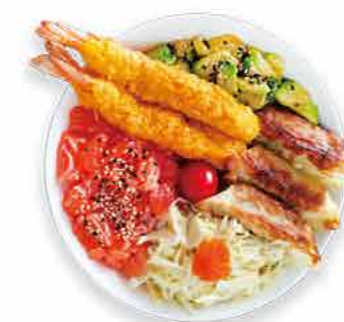
GP2 14.50€ Gyoza Poké Tempura 3 Gyoza (raviolis grillés au poulet), tartare saumon, tomate, salade de choux, avocat, 2 tempura crevettes et sésames sur un bol de riz vinaigré