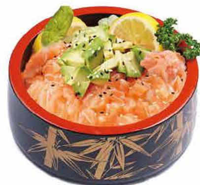
MENU C5 14.80€ CHIRASHI TARTARE SAUMON Tartare de saumon cru et avocat sur un grand bol de riz vinaigré