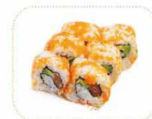
K 6 masago saumon avocat