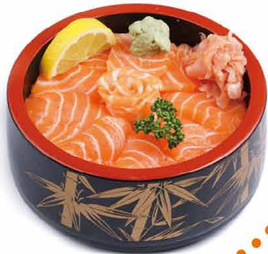
MENU C1 13.50€ CHIRASHI SAUMON Tranches de saumon cru sur un grand bol de riz vinaigré