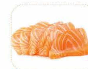
D 6 sashimi saumon