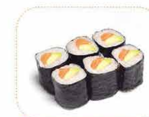
C 6 maki saumon avocat