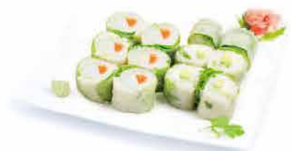
MENU M7 14.50€ 6 printemps roll avocat cheese 6 printemps saumon cheese