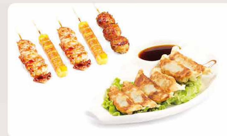
MENU B4 13.50€ 6 raviolis grillés, 5 brochettes: 2 poulet, 2 boeuf au fromage, 1 boulette de poulet