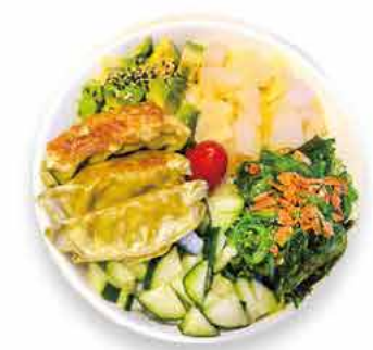
GP4 14.50€ Gyoza Poké végétarien 3 Gyoza (raviolis grillés aux légumes), salade d'algue, tomate, avocat, concombre, oignons frits, sésames sur un bol de riz vinaigré