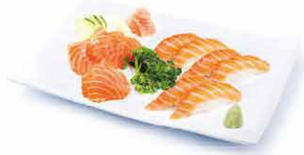
MENU M2 14.80€ 6 sushi saumon, 6 sashimi saumon + riz