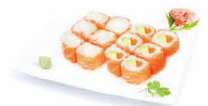
MENU M9 15,00€ 6 saumon roll cheese, 6 saumon roll saumon avocat