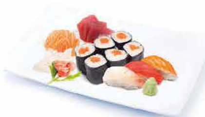
MENU M4 16.00€ 3 sushi assortis, 9 sashimi assortis 6 maki saumon + riz