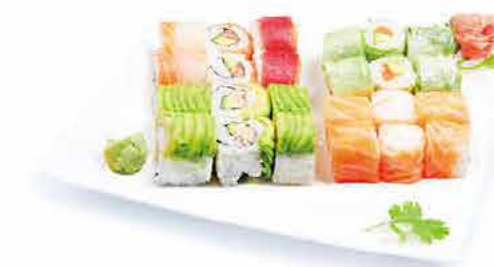
MENU K11 CALIFORNIA LOVE 30.90€ 6 saumon roll cheese 6 dragon roll thon cuit 6 arc en ciel roll saumon 6 printemps roll saumon avocat 1 dessert (2 perle coco ou nougat au choix)