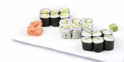
MENU V3 13.80€ 6 maki avocat, 6 maki concombre, 6 california avocat concombre