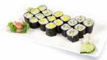
MENU V1 10.80€ 6 maki radis, 6 maki avocat, 6 maki concombre