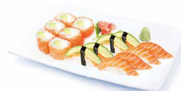
MENU K10 18.50€ 6 saumon roll cheese avocat 4 sushi saumon 4 sushi avocat saumon