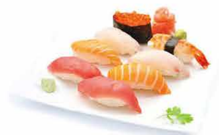
MENU K5 14.80€ 8 sushi assortiment (2 saumon, 2 thon, 1 crevette, 2 daurade, 1 oeufs saumon)