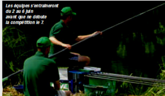
Les équipes s'entraînent du 2 au 6 juin avant que ne débute la compétition le 7.