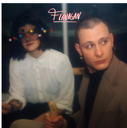
The Bastard (2020)