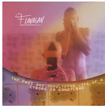
The Fast and Tumultuous Life of a Cyborg in Kandyland (2021)