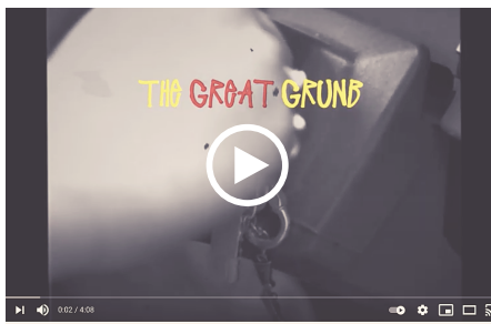
THE GREAT GRUNB (2020)