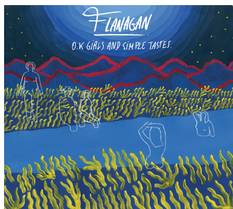
Ok Girls & Simple Tastes (2017)