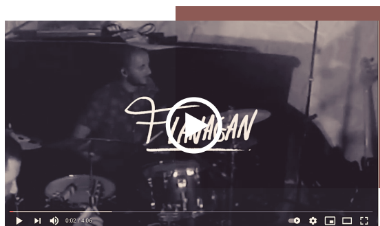
SARIN VX-II - Live Session