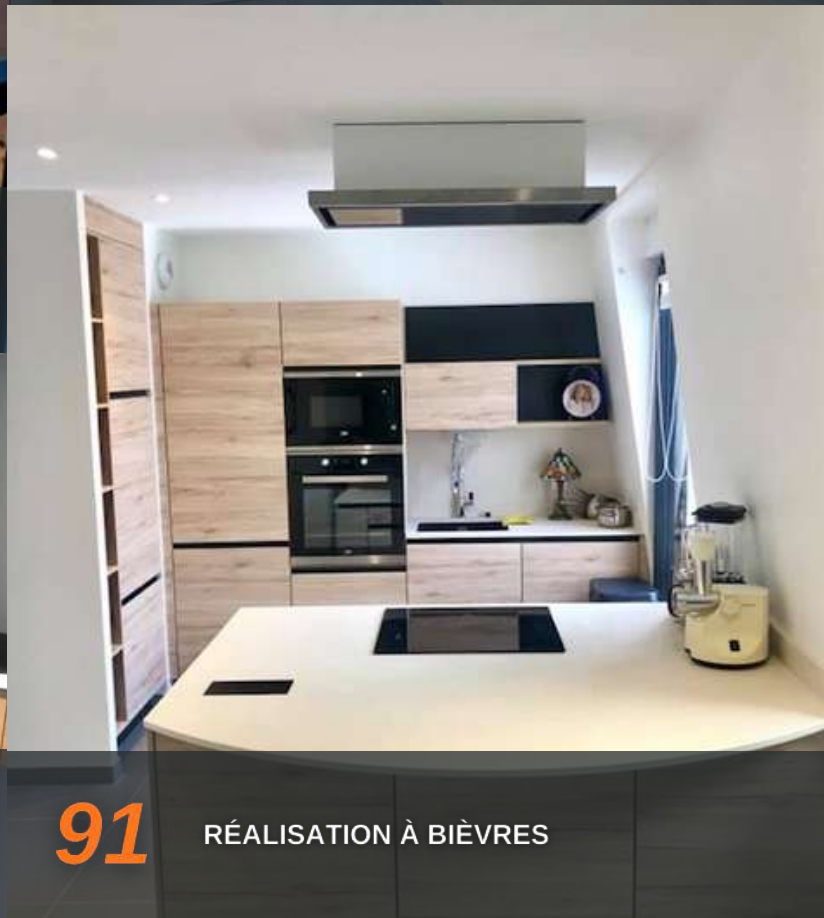
91 RÉALISATION À BIÈVRES