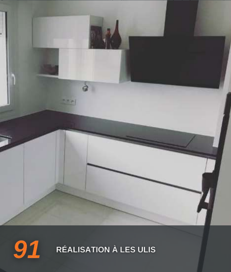
91 RÉALISATION À LES ULIS