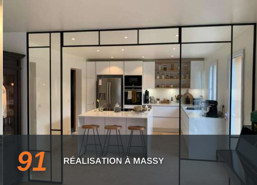
91 RÉALISATION À MASSY