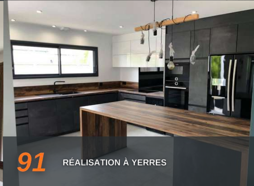
91 RÉALISATION À YERRES