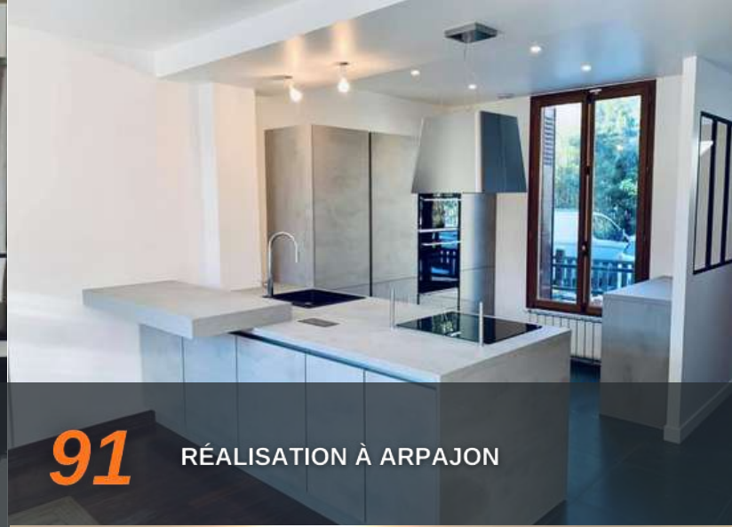
91 RÉALISATION À ARPAJON