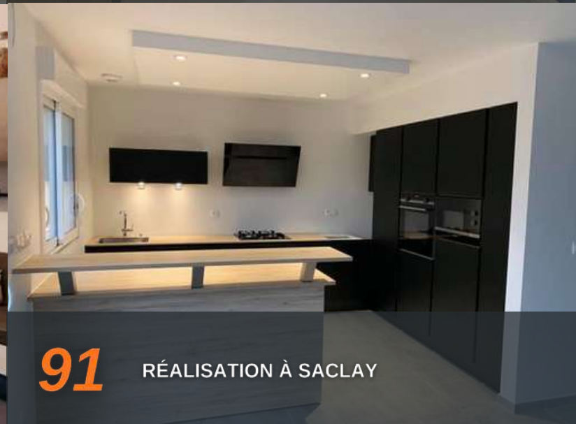
91 RÉALISATION À SACLAY