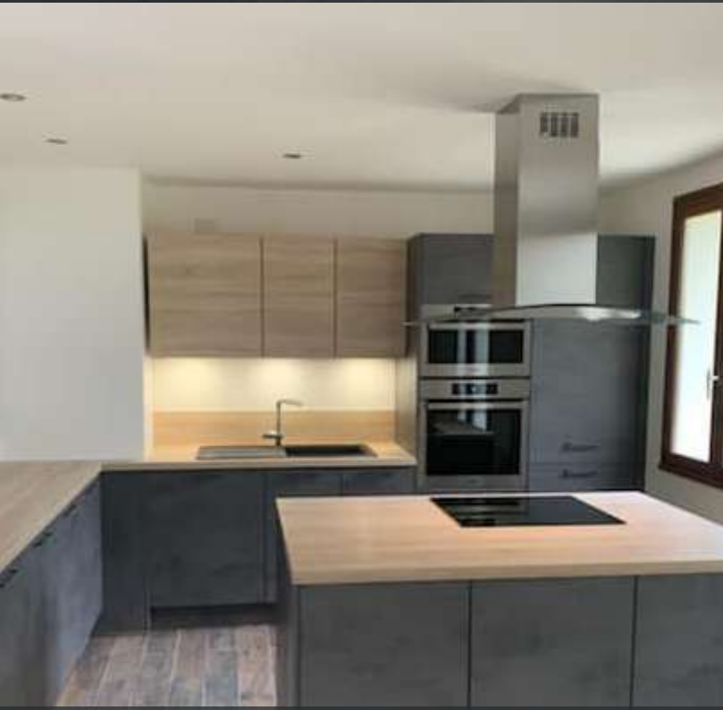
91 RÉALISATION À GRIGNY