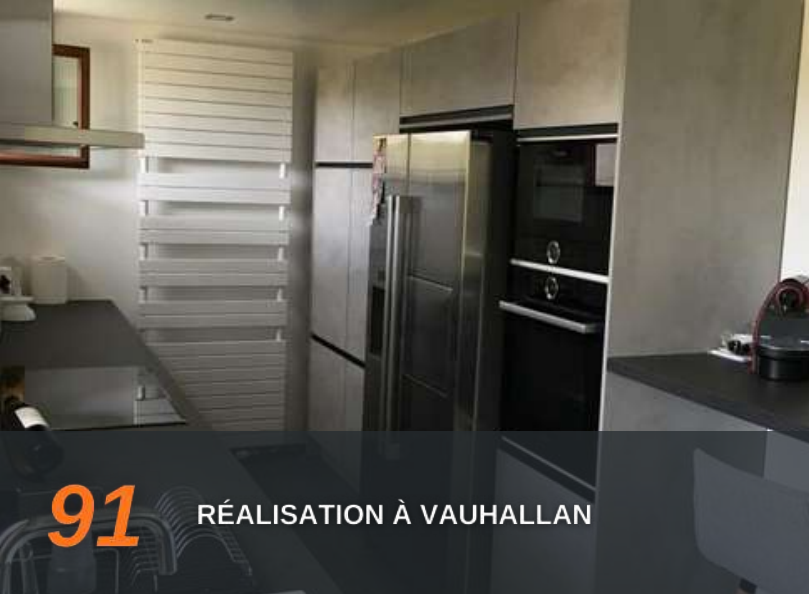
91 RÉALISATION À VAUHALLAN