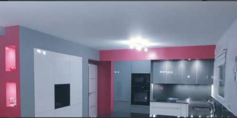
91 RÉALISATION À SAVIGNY-SUR-ORGE