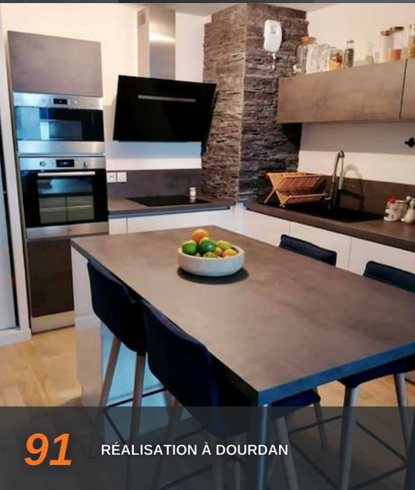
91 RÉALISATION À DOURDAN