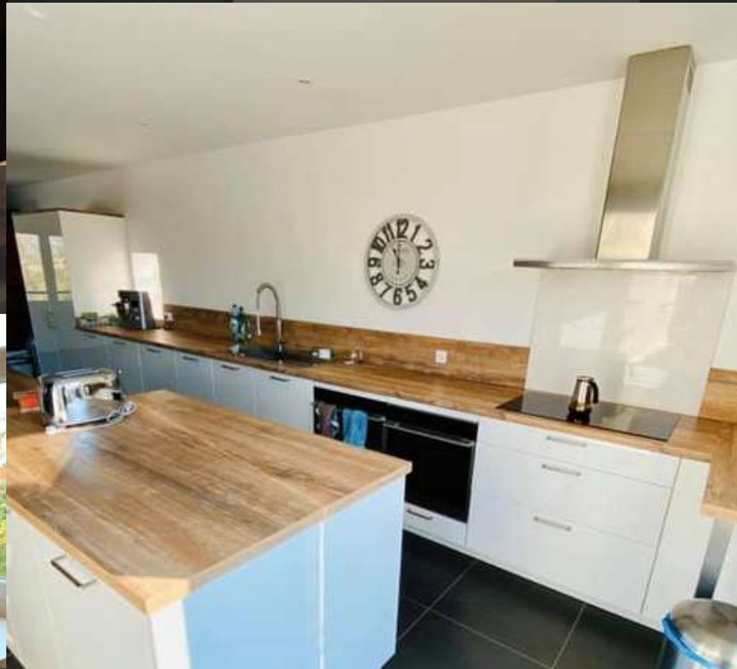
91 RÉALISATION À MOLIÈRES