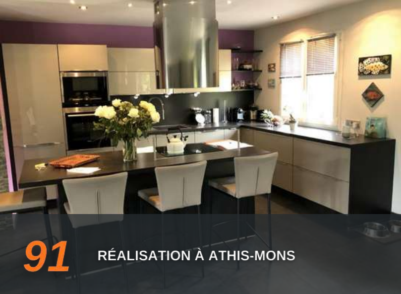
91 RÉALISATION À ATHIS-MONS