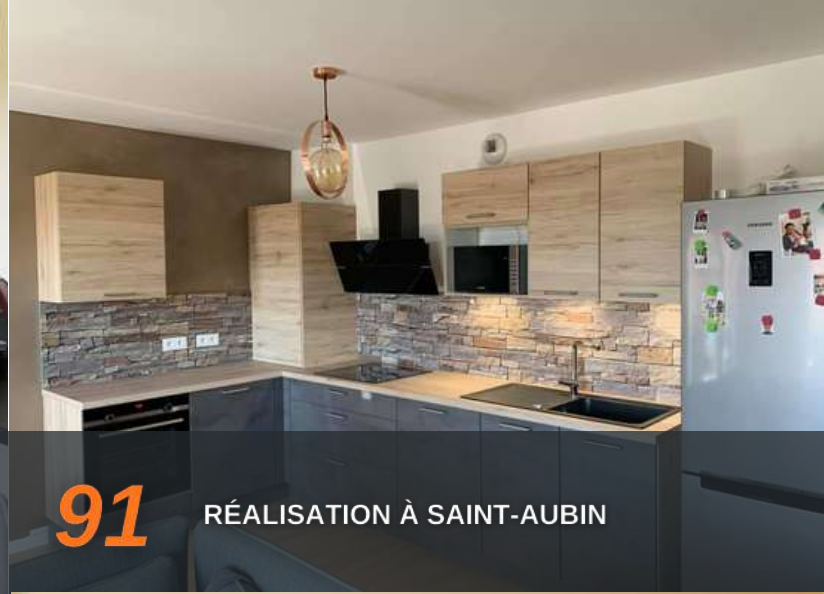
91 RÉALISATION À SAINT-AUBIN