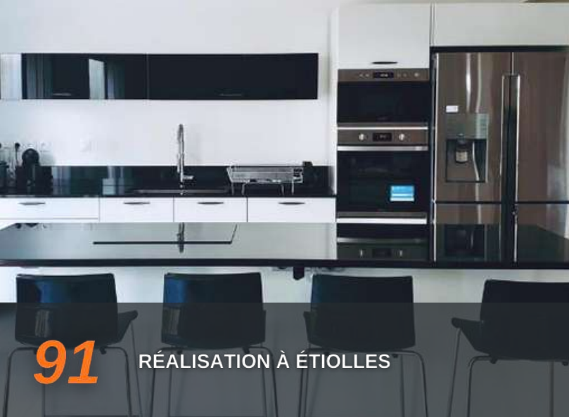
91 RÉALISATION À ÉTIOLLES