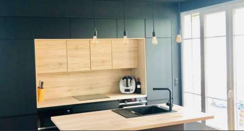
91 RÉALISATION À LONGJUMEAU