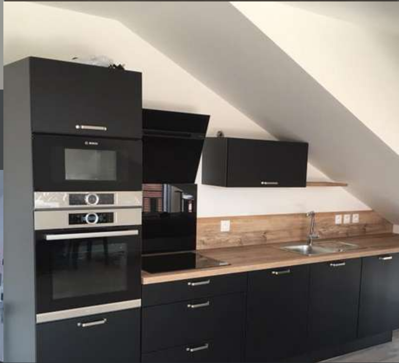
91 RÉALISATION À MONTGERON