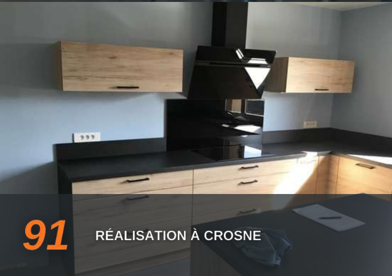
91 RÉALISATION À CROSNE