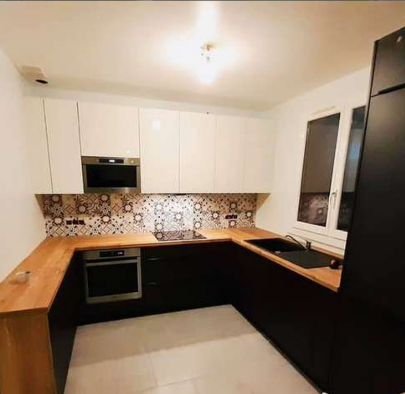
91 RÉALISATION À BURES-SUR-YVETTE