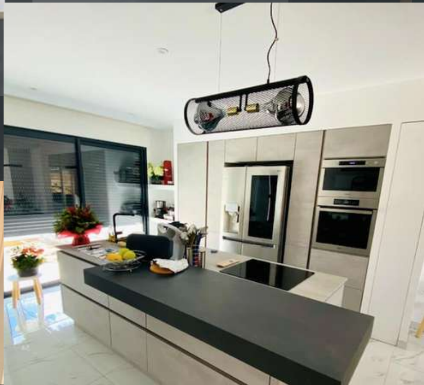
91 RÉALISATION À GIF-SUR-YVETTE