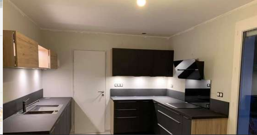
91 RÉALISATION À PALAISEAU