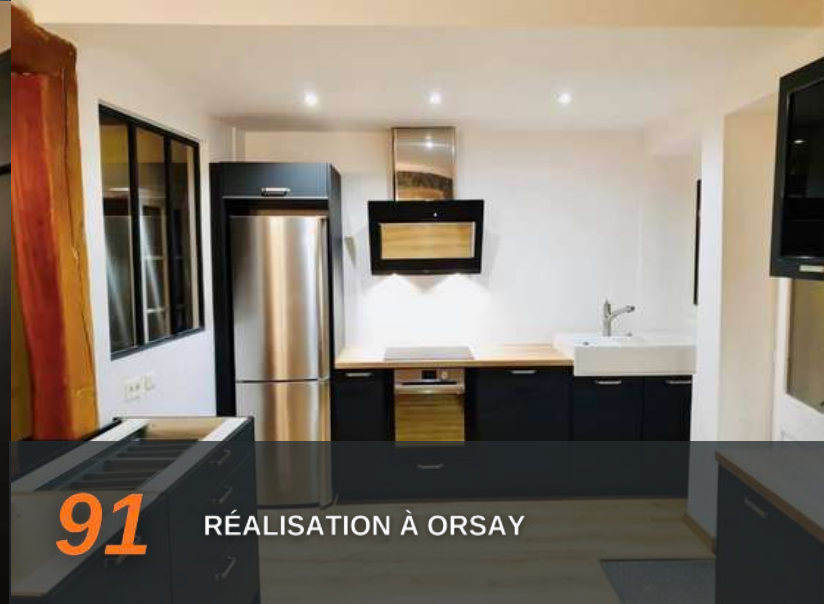
91 RÉALISATION À ORSAY