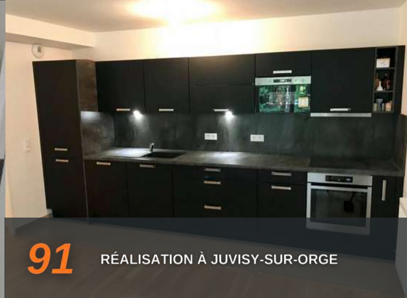
91 RÉALISATION À JUVISY-SUR-ORGE