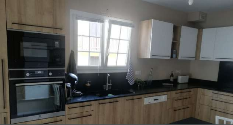
65 RÉALISATION À BARTRÈS