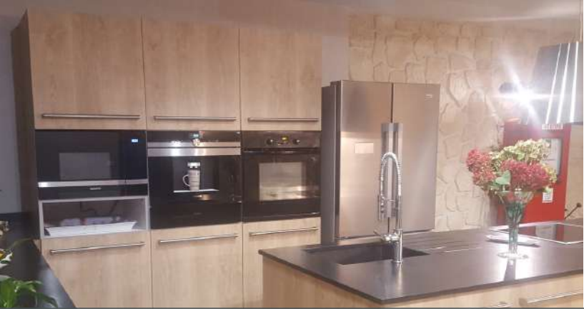
64 RÉALISATION À SOUMOULOU