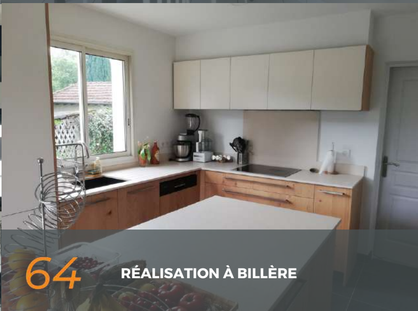
64 RÉALISATION À BILLÈRE