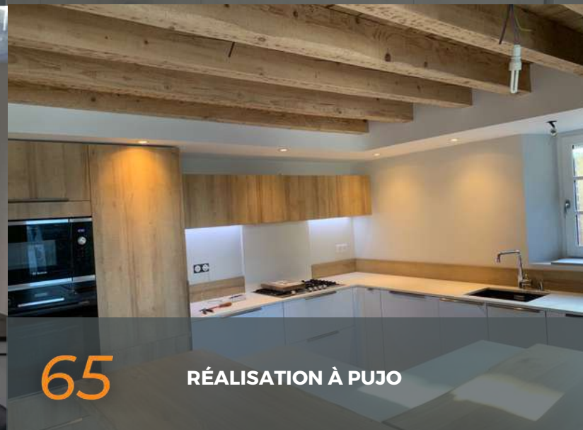
65 RÉALISATION À PUJO