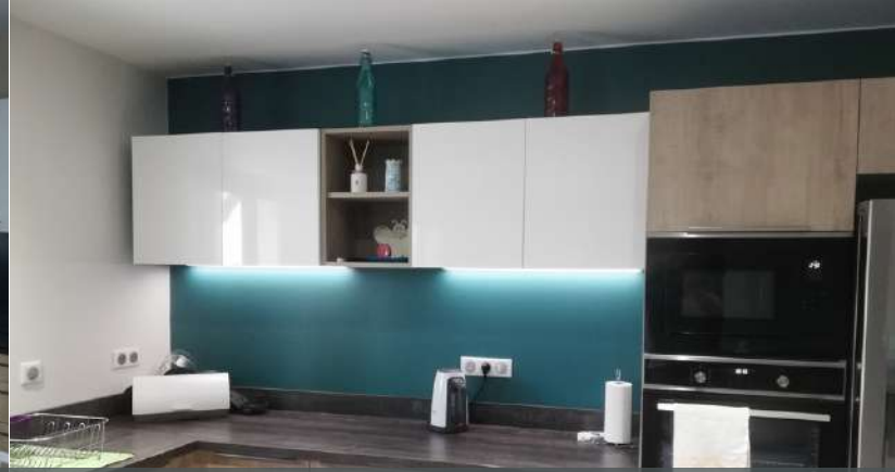
65 RÉALISATION À ANTIN