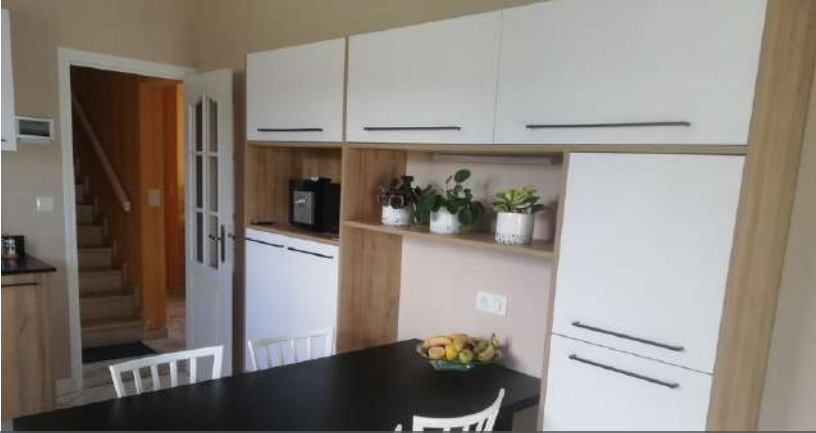
64 RÉALISATION À AUBERTIN