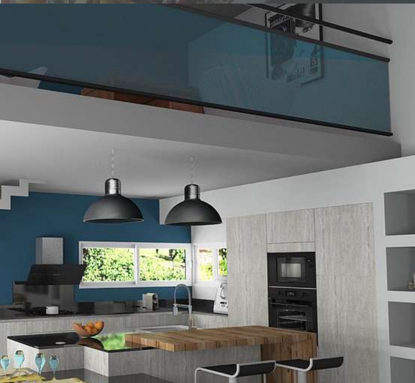
64 RÉALISATION À PAU