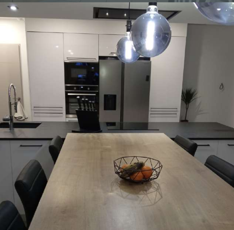
65 RÉALISATION À CLARAC