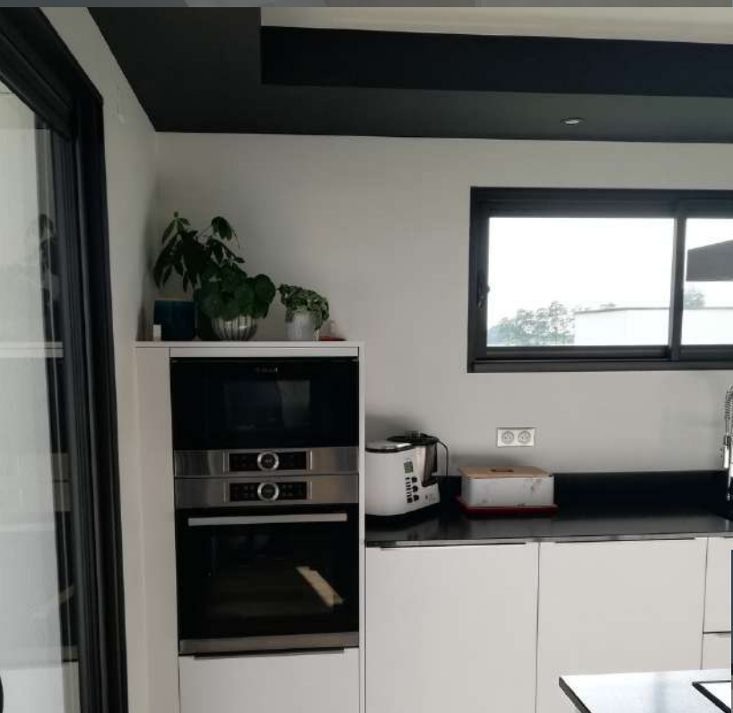
64 RÉALISATION À PAU