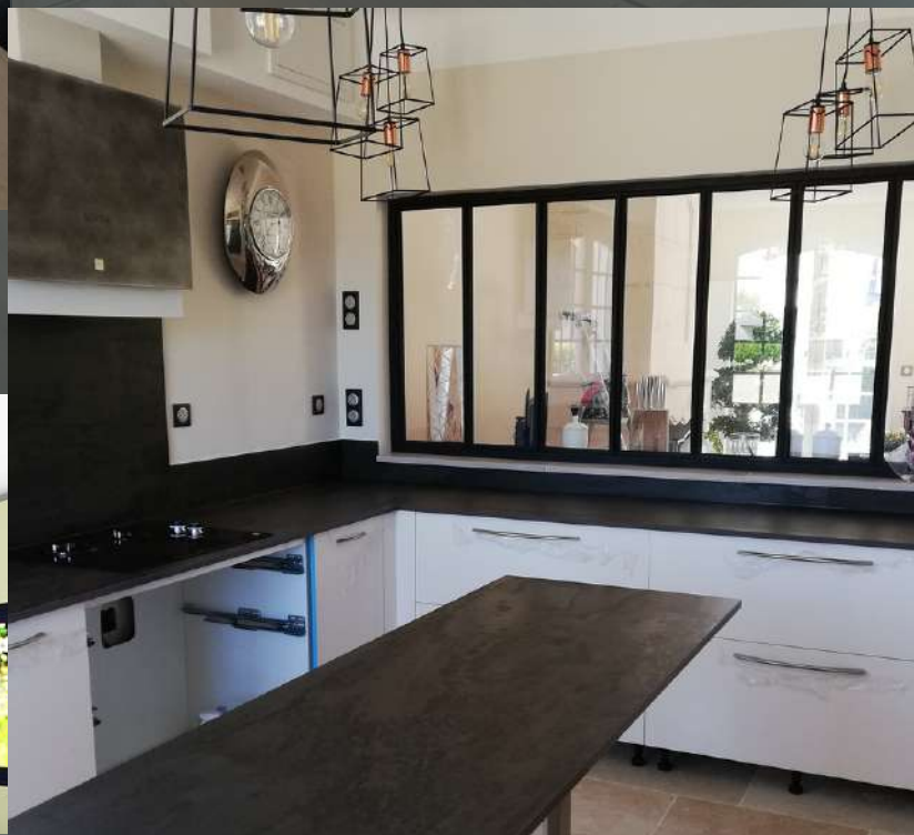
65 RÉALISATION À IBOS