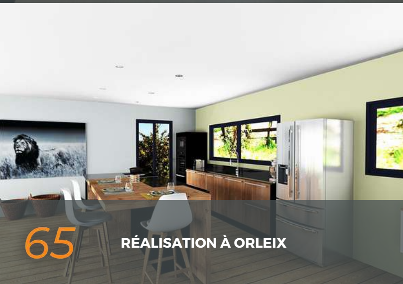
65 RÉALISATION À ORLEIX