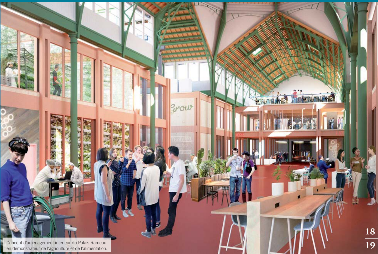
Concept d'aménagement intérieur du Palais Rameau en démonstrateur de l'agriculture et de l'alimentation.