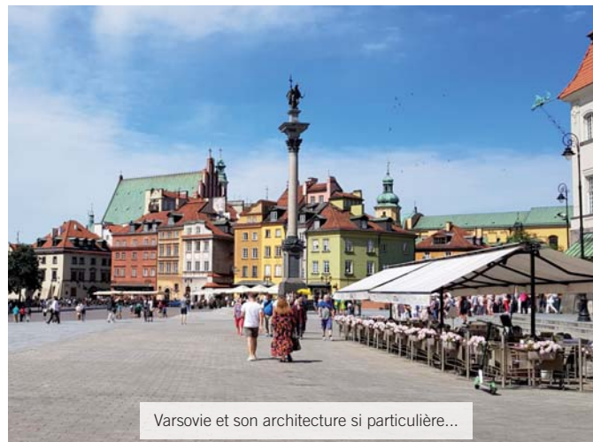
Varsovie et son architecture si particulière...

Ma mission a pris du retard en raison d'une chute imprévue de la production. Après quelques semaines à m'occuper en prêtant main forte à d'autres services, je me suis posée la question de savoir s'il valait mieux rentrer en France mais tout s'est finalement débloqué et j'ai