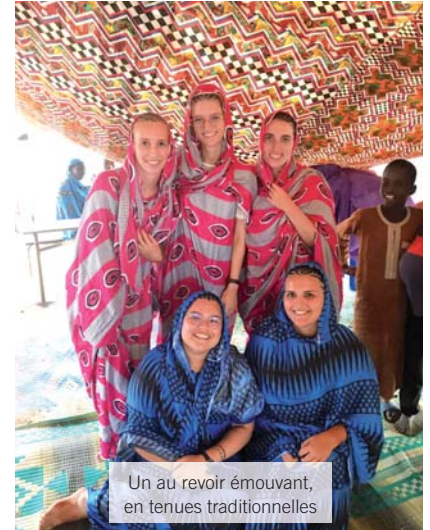
Un au revoir émouvant, en tenues traditionnelles

✳ Une telle expérience apprend à mener un projet en se fixant des objectifs, à construire un budget et à le respecter. Cela sera forcément utile dans ma future vie d'ingénieur.