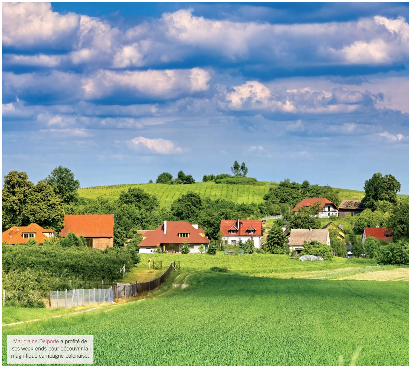
Marjolaine Delporte a profité de ses week-ends pour découvrir la magnifique campagne polonaise.

“ Marjolaine Delporte (2019) Ingénieur Méthodes Junior - Provost