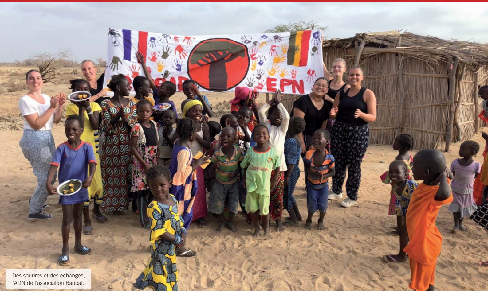
Des sourires et des échanges, l'ADN de l'association Baobab.