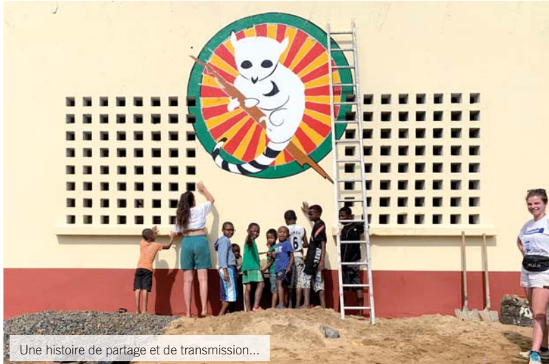
Une histoire de partage et de transmission...