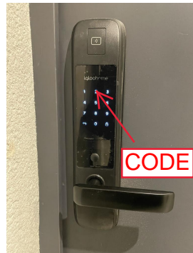
You will find a connected handle: Enter the code that you must have received by email beforehand/ Vous trouverez une poignée connectée: Saisissez le code que vous avez dû recevoir par e-mail au préalable