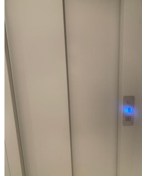
Take the elevator/Prenez l'ascenseur