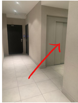
Go in the direction of the elevator/Allez en direction de l'ascenseur