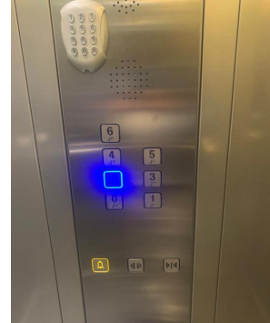
Enter the elevator code: 2702 and go up to the 2nd floor/Faites le code de l'ascenseur : 2702 puis montez au 2ème étage