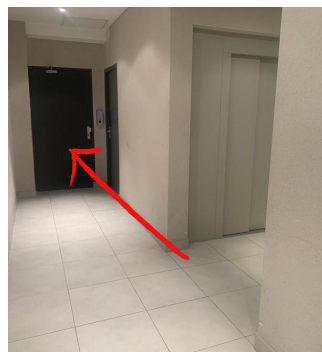
In case of elevator failure, you can use the stairs through here/ En cas de panne d'ascenseur, vous pouvez utiliser les escaliers en passant par ici