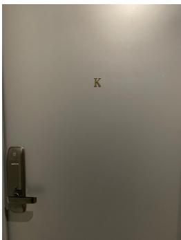
Suite K is located at the exit of the elevator on your right/ La suite K se trouve à votre sortie de l'ascenseur sur votre droite