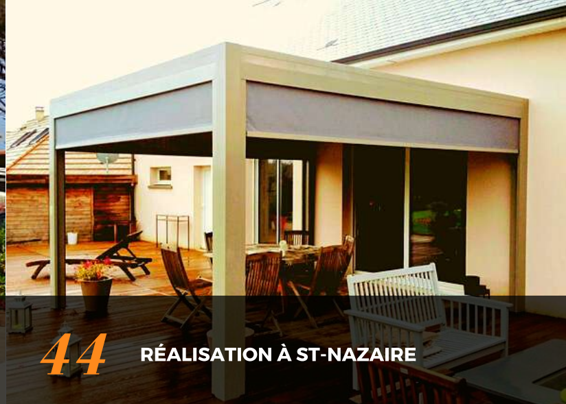
44 RÉALISATION À ST-NAZAIRE