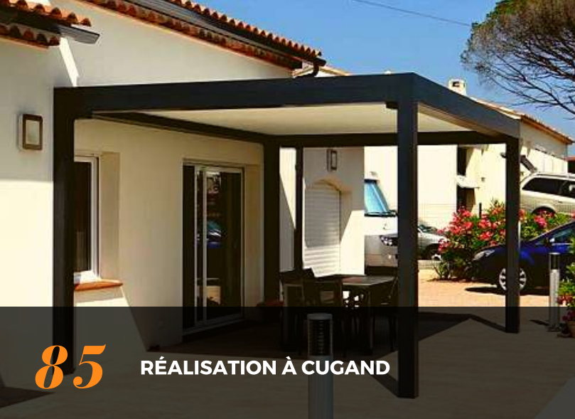
85 RÉALISATION À CUGAND