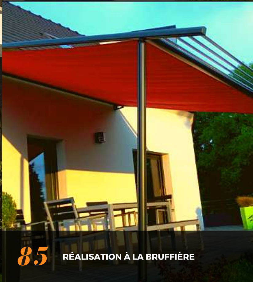
85 RÉALISATION À LA BRUFFIÈRE