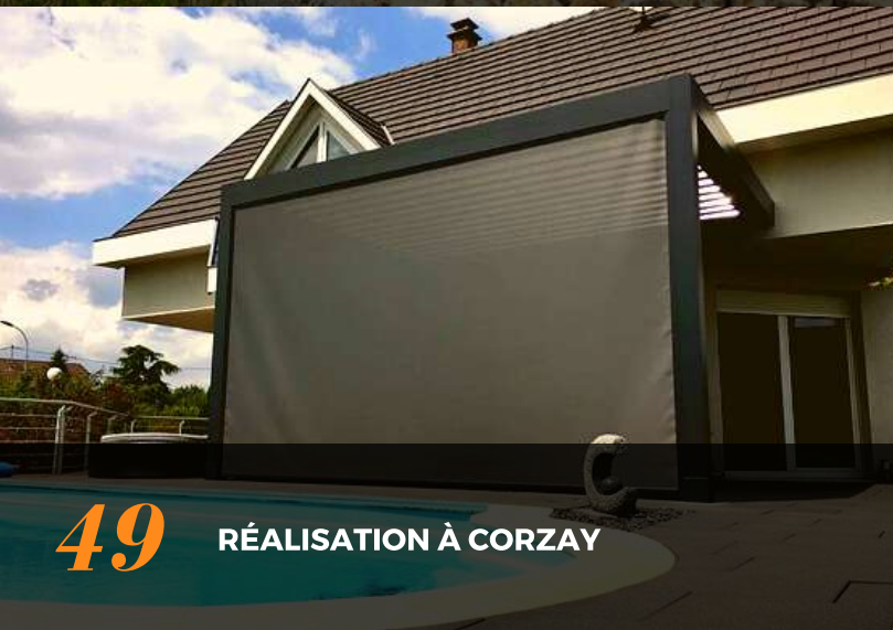
49 RÉALISATION À CORZAY