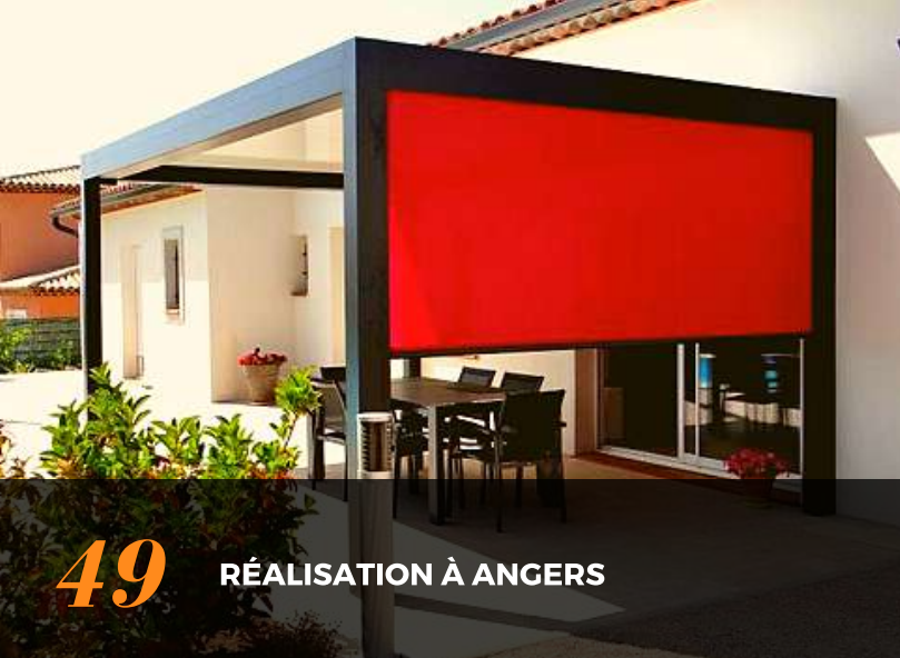
49 RÉALISATION À ANGERS