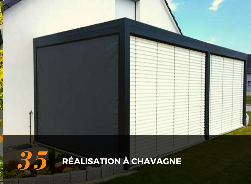
35 RÉALISATION À CHAVAGNE