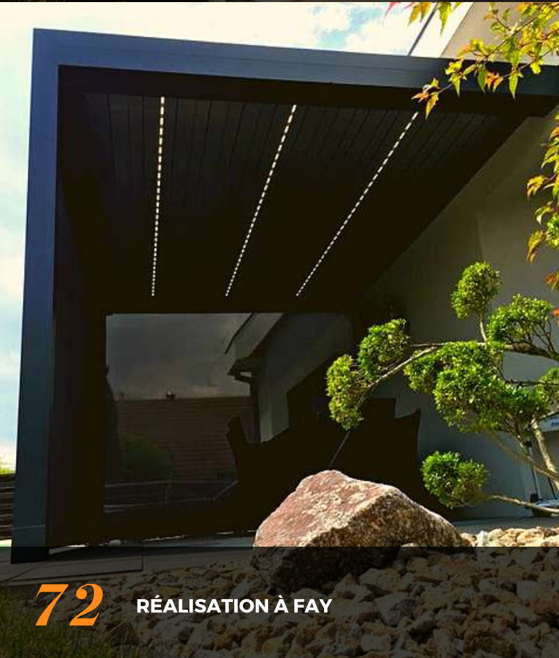
72 RÉALISATION À FAY