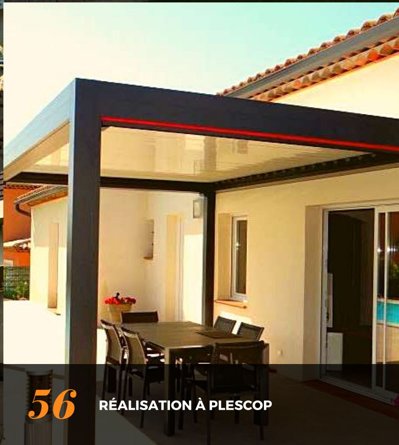
56 RÉALISATION À PLESCOP