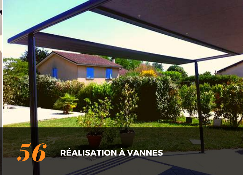
56 RÉALISATION À VANNES