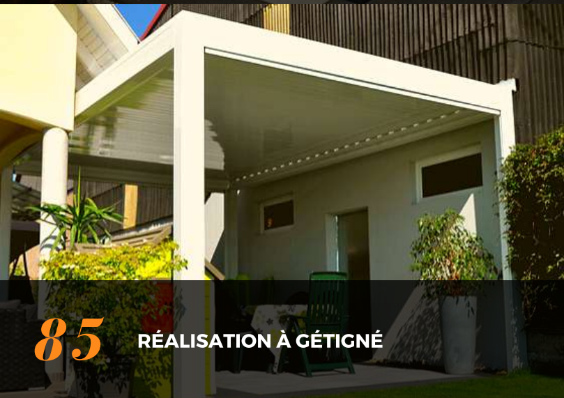
85 RÉALISATION À GÉTIGNÉ