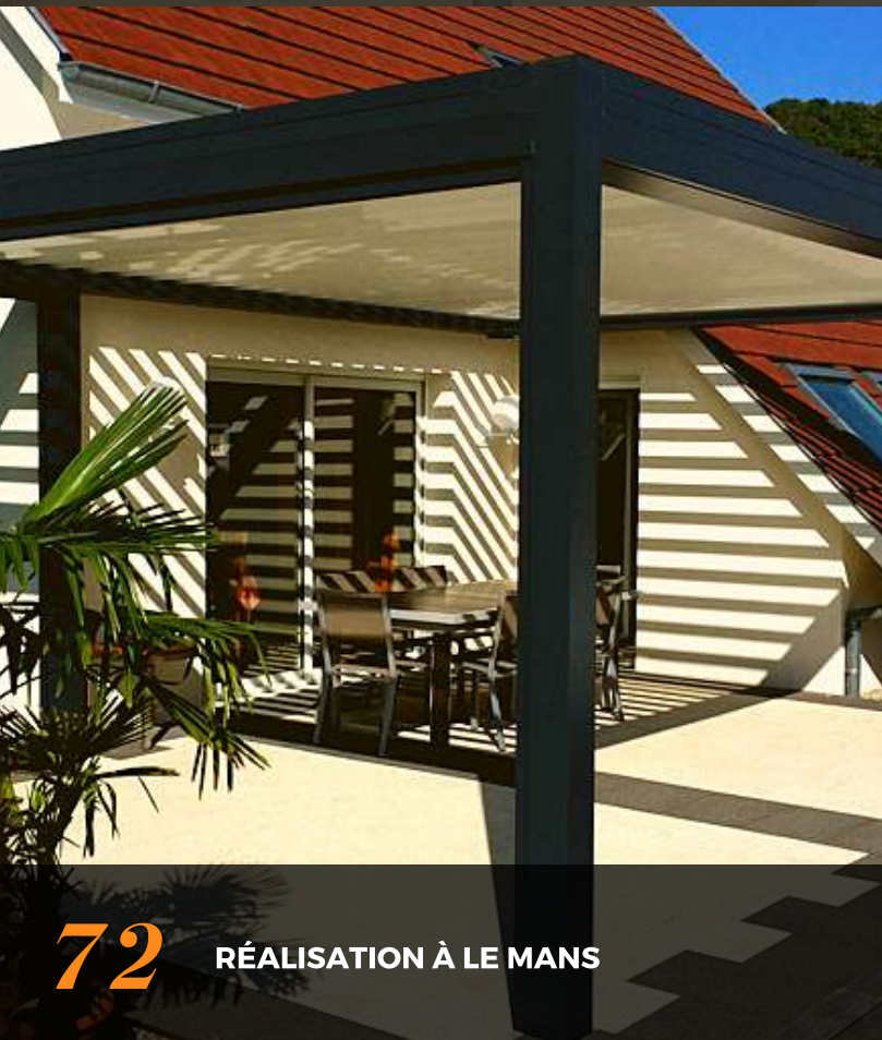
72 RÉALISATION À LE MANS