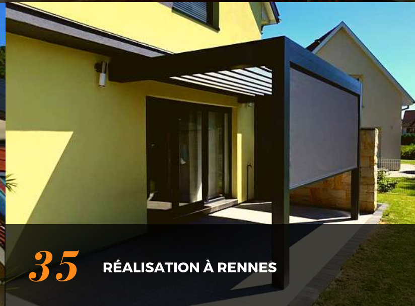
35 RÉALISATION À RENNES