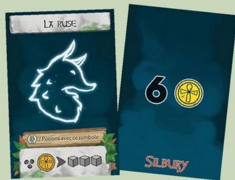
6 Cartes «faveur» (Version «initié» uniquement)