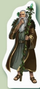
1 Figurine «grand druide»