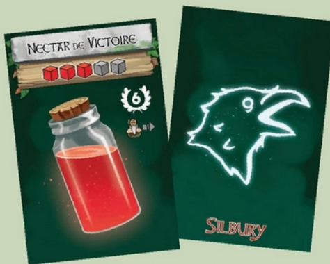
30 cartes «potion» (6 familles de potions aux symboles différents)