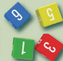
4 dés d'action de récolte