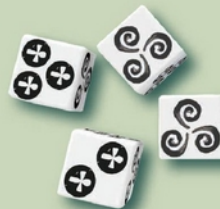
4 dés d'action spéciaux