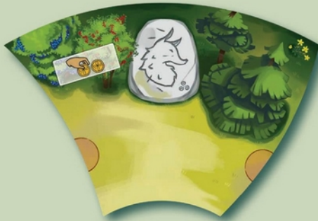
6 Tuiles «clairière» (Plateau de jeu)