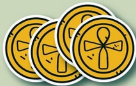
24 Pièces d'or