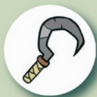
1 Jeton «serpe» (premier joueur)