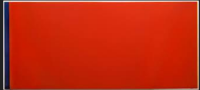
Who's afraid of red yellow 1966-1967 Barnett Newman