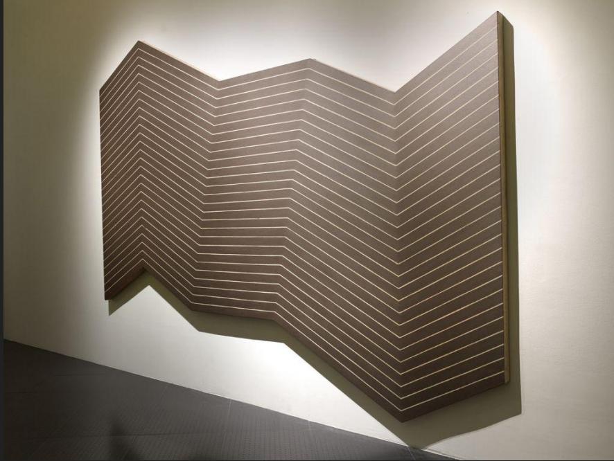
Mas o Meos, 1964, Frank Stella