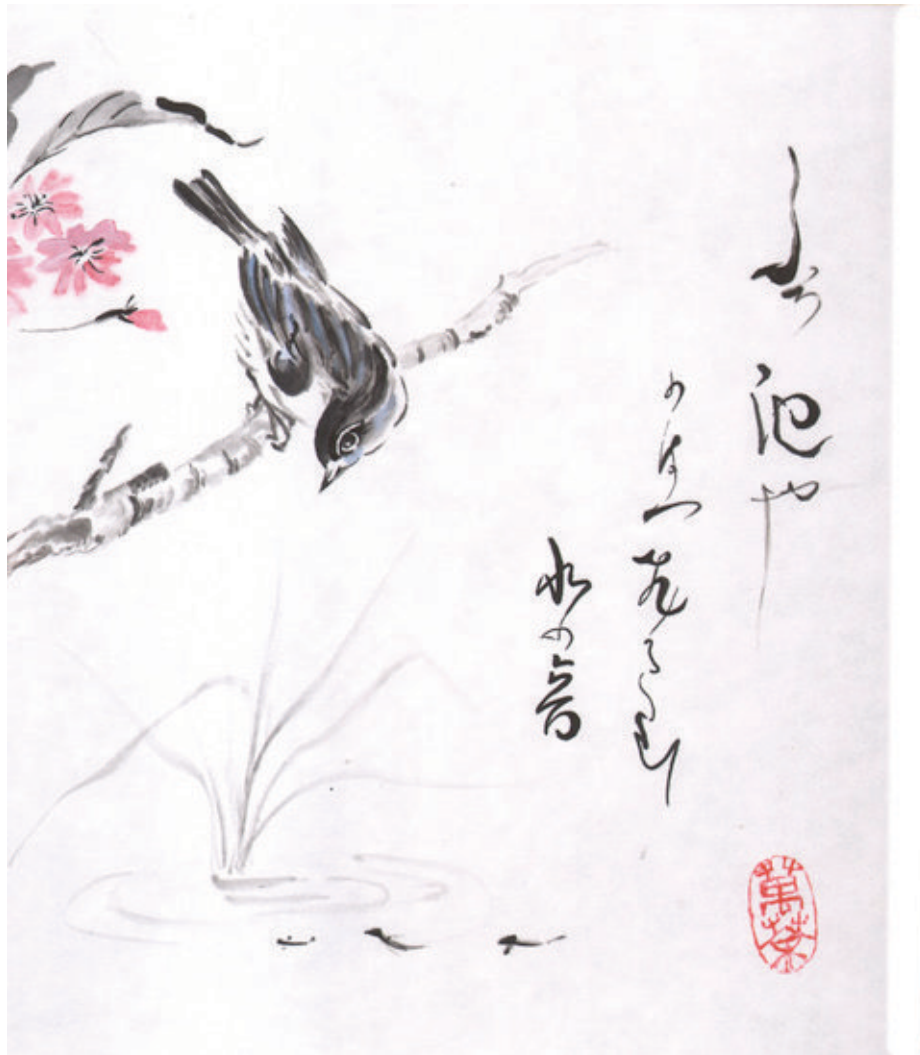
"Le vieil étang/ La grenouille saute/ bruit de l'eau" Manda