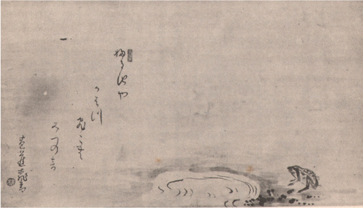
"Le vieil étang/ La grenouille saute/ bruit de l'eau" Bashō (1644-1694)