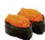
SU14 4,80€ massago orange