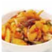
9 salade d'algue au calamar 5,50€