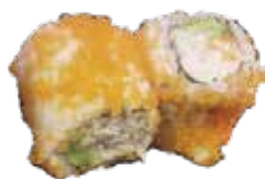
E2 6,50€ thon cuit avocat