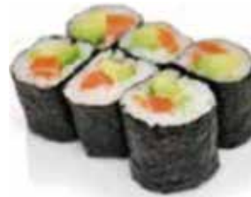
C. 6 maki saumon avocat