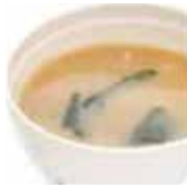
1 soupe miso 2,00€