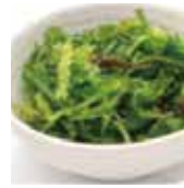
5 salade d'algue 5,00€