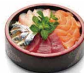
C3 15.20€ Chirashi assortiment sur bol de riz vinaigré