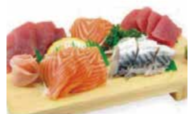
M6 16.90€ 1 soupe, 1 salade, 1 riz 20 sashimi assortiment ( 8 saumon, 4 thon, 4 daurade, 4 maquereau )