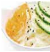
2 salade chou 2,50€