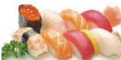
K5 14.80€ 8 sushi assortiment (2 saumon, 2 thon, 1 crevette, 2 daurade, 1 oeuf saumon )