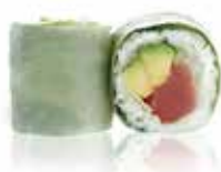
71 6,00€ thon avocat