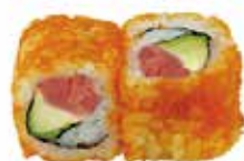
E6 6,50€ thon avocat