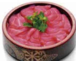
C2 14.80€ Chirashi thon sur bol de riz vinaigré