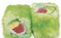
R6 6,50€ thon avocat