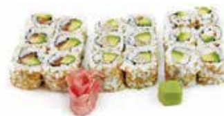
K3 14.80€ 6 california saumon, 6 california thon cuit, 6 california surimi