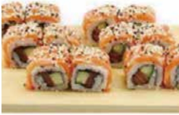
M1 14.50€ 1 soupe, 1 salade 12 las vegas roll, (saumon avocat et thon avocat)