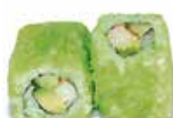
R3 6,50€ surimi avocat