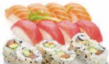
K4 16.50€ 6 california saumon avocat, 8 sushi (4 saumon, 4 thon)