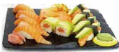
K10 18.50€ sushi saumon roll 6 saumon roll cheese avocat 4 sushi saumon 4 sushi avocat saumon