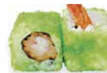
R8 6,50€ tempura crevette