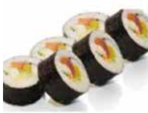
F. 6 Futo maki (saumon, thon, surimi, avocat concombre)