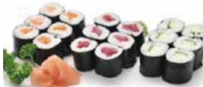
K1 11.80€ 6 maki saumon, 6 maki thon, 6 maki concombre