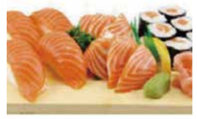
M3 15.80€ 1 soupe, 1 salade, 1 riz 4 sushi saumon, 6 maki saumon 6 sashimi saumon