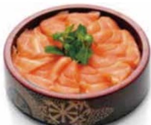
C1 13.50€ Chirashi saumon sur bol de riz vinaigré