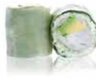
73 6,00€ cheese avocat