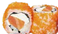
E7 6,50€ saumon chesse