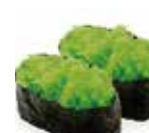
SU16 4,80€ tobicco wasabi