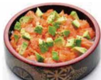
C5 14.80€ Chirashi tartare saumon sur bol de riz vinaigré