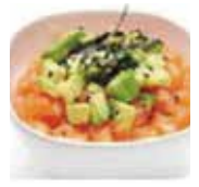
7 tartare de saumon avocat 5,00€