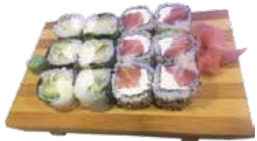
M7 14,50€ 1 soupe, 1 salade, 6 printemps roll avocat cheese 6 california saumon cheese