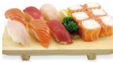
M8 17,00€ 1 soupe, 1 salade, 6 sushi (2 thon, 2 saumon, 2 daurade), 6 saumon roll cheese