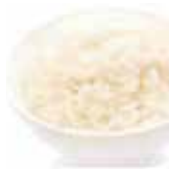
3 riz nature 2,00€