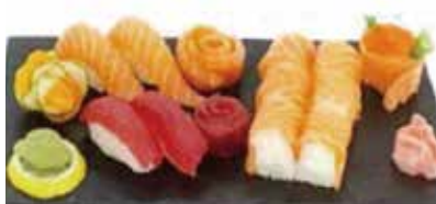
K8 18.80€ soupe , salade, riz 6 saumon roll cheese, 6 sashimi (3 saumon, 3 thon) 4 sushi (2 saumon cheese, 2 thon cheese)