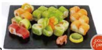
K11 California Love 30.90€ 6 saumon roll ( cheese) 6 dragon roll (thon cuit ) 6 arc en ciel roll ( saumon ) 6 printemps roll (saumon avocat ) (2 perle coco ou nougat au choix)