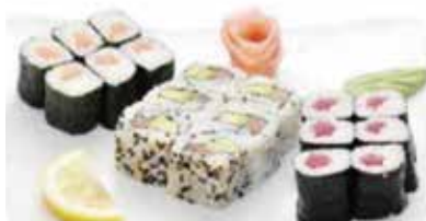
K2 13.80€ 6 maki saumon, 6 maki thon, 6 california saumon avocat