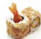
64C 6,50€ tempura crevette