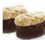
SU9 4,50€ sushi thon cuit