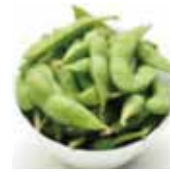
6 edamamé 5,00€