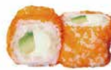
E4 6,50€ avocat cheese