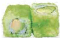
R2 6,50€ thon cuit avocat