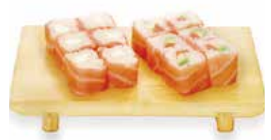
M9 15,00€ 1 soupe, 1 salade, 6 saumon roll cheese, 6 saumon roll saumon avocat