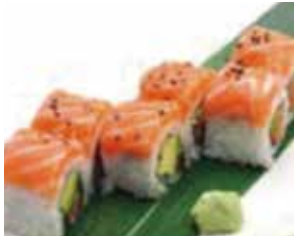
A. california las vegas saumon ou surimi

servis avec 1 soupe, 1 salade, 1 riz, 2 plats au choix tous les jours (Veuillez ne pas répéter les plats)