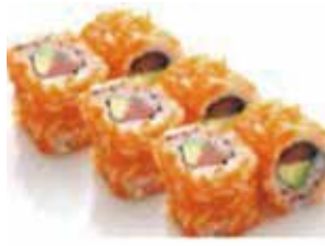
K. 6 masago saumon avocat