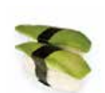
SU10 3,70€ sushi avocat