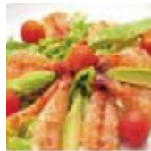
11 salade crevette avocat 9,80€