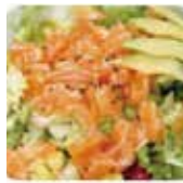
10 salade d'avocat saumon 9,80€