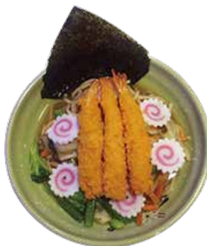
C7 18.90€ Ramen tempura crevette légume