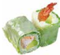
72 6,00€ crevette avocat