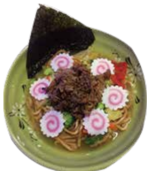
C6 17.90€ Ramen nouille bœuf légume