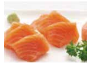
D. 6 sashimi saumon