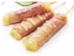
E. 3 boeuf fromage