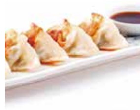
L. gyoza (6 pièces)