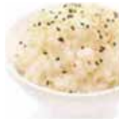
4 riz vinaigré 2,50€