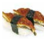
SU12 5,80€ sushi anguille