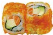
E1 6,50€ saumon avocat