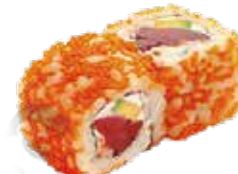
E8 6,50€ thon chesse