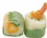
75C 6,50€ tempura crevette