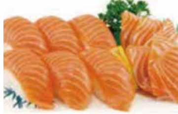
M2 14.80€ 1 soupe, 1 salade, 1 riz 6 sushi saumon, 6 sashimi saumon