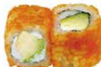
E3 6,50€ avocat concombre