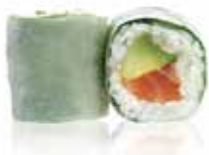
70 6,00€ saumon avocat