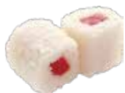
51 4,00€ thon