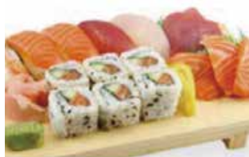
M5 17.90€ 1 soupe, 1 salade, 1 riz 5 sushi assortis, 6 california saumon avocat 6 sashimi (3 saumon, 3 thon)