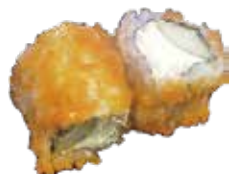
E5 6,50€ concombre cheese