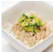
8 tartare de thon cuit 5,00€