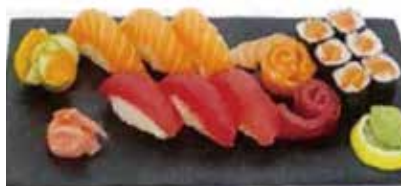
K7 18.00€ soupe , salade, riz 6 maki saumon, 6 sushi (3 saumon, 3 thon) 6 sashimi (3 saumon, 3 thon)