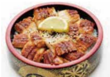
C4 17.80€ Chirashi anguille sur bol de riz nature