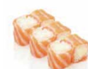
H. 6 saumon roll cheese