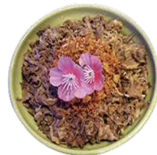
C8 18.90€ Chirashi bœuf oignon frit + Riz