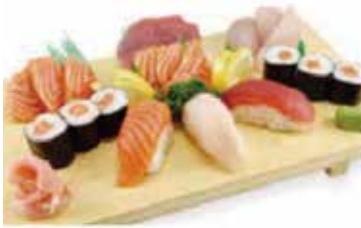
M4 16.00€ 1 soupe, 1 salade, 1 riz 3 sushi assortis, 9 sashimi assortis 6 maki saumon