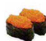
SU15 4,80€ tobicco orange