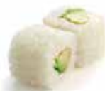
53 4,00€ avocat