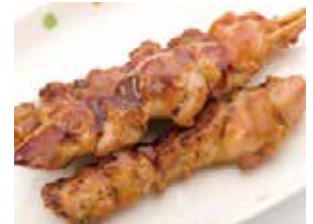
L1. brochette de poulet (3 pièces)