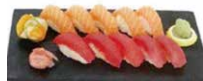
K6 16.80€ 10 sushi duo (5 saumon, 5 thon)