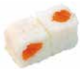
50 4,00€ saumon