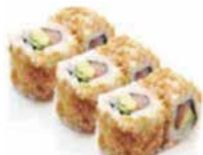
J. 6 california oignon frit saumon avocat ou thon cuit avocat