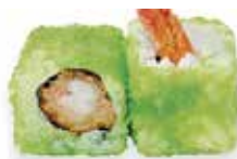
R7 6,50€ crevette avocat