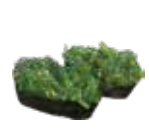
SU11 4,00€ sushi algue