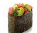
SU13 4,80€ sushi tartare thon avocat