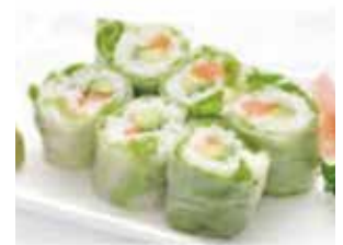
I. 6 printemps saumon avocat ou thon cuit