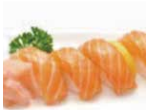
B. 4 sushi saumon