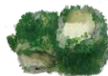
R4 6,50€ avocat cheese