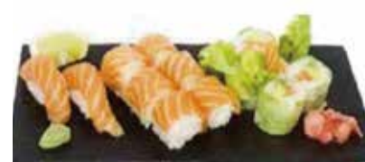
K9 16.80€ saumon cheese 2 sushi saumon, 6 saumon roll cheese, 6 printemps roll saumon