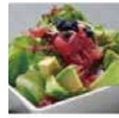
13 salade thon avocat 10,80€