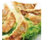
14 gyoza poulet ou légume 6 pièces 5,50€