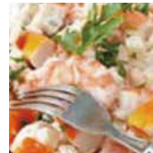
12 salade surimi avocat 7,50€