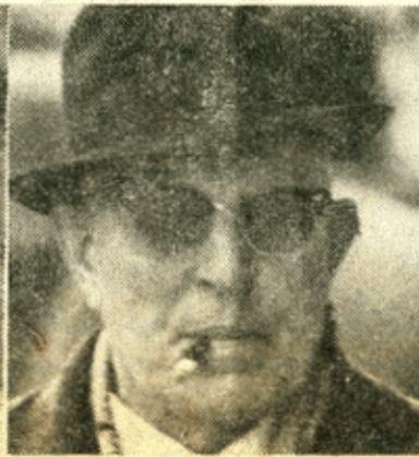
A. Villas Boas