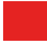
Double page centrale 420 x 297 mm