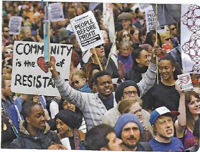
Manifestation des habitants de Brixton, un quartier du sud de Londres, le 25 avril 2015, contre un projet immobilier qui pousse la population issue de l'immigration afro-caribéenne hors du centre du fait de la hausse des loyers.