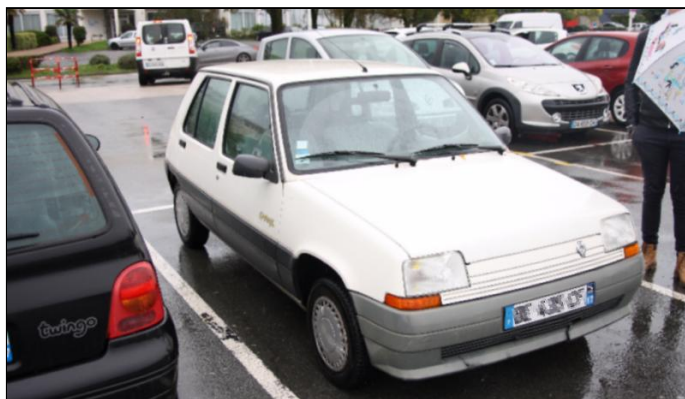
RENAULT 5 SL Spring (1988-1991).