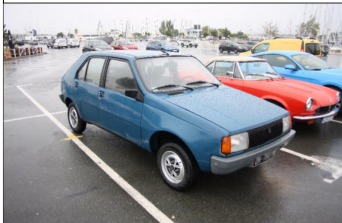
RENAULT 14 TL (1980-1983).