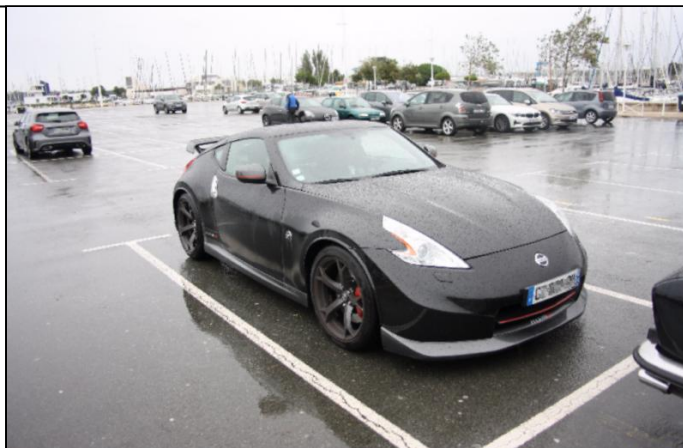
NISSAN 370Z Nismo de 2013.