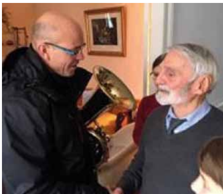
Sainte Cécile et la traditionnelle "aubade" des Vrais Amis au Maire.