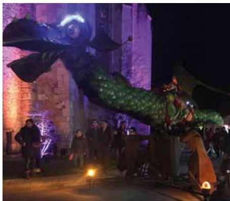
Le magnifique marché de Noël autour de la collégiale.