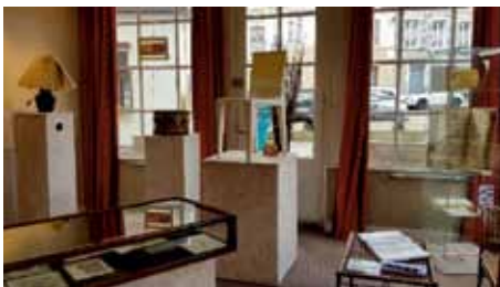
Maison de bois et exposition d'objet en parchemin

La grande Fête traditionnelle du Cuir et du Parchemin a quant à elle eu lieu les 26 et 27 octobre au Château de Bouges. Cette délocalisation exceptionnelle de l'événement est intervenue dans le cadre des "500 ans