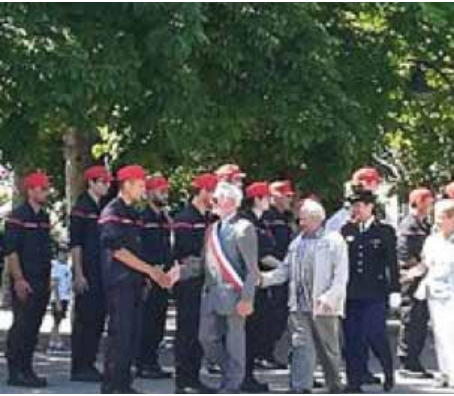
Défilé du 14 juillet avec Revue des Pompiers et le magnifique feu d'artifice.