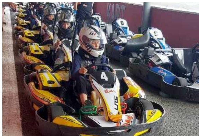
Karting (séjour ados)

Pour l'année 2019/2020, le thème s'orientera sur «LA NATURE» avec des sorties (aquarium, cinéma, la Haute Touche...) pour toutes les tranches d'âges, de la maternelle au CM2 (pour les petites vacances) et jusqu'à 16 ans pour le