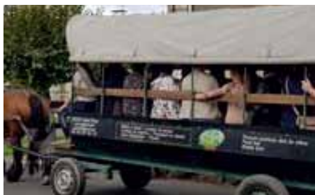
Balade en calèche dans les rues de Levroux

Les festivités ont débuté le dimanche 13 octobre à Levroux pour découvrir