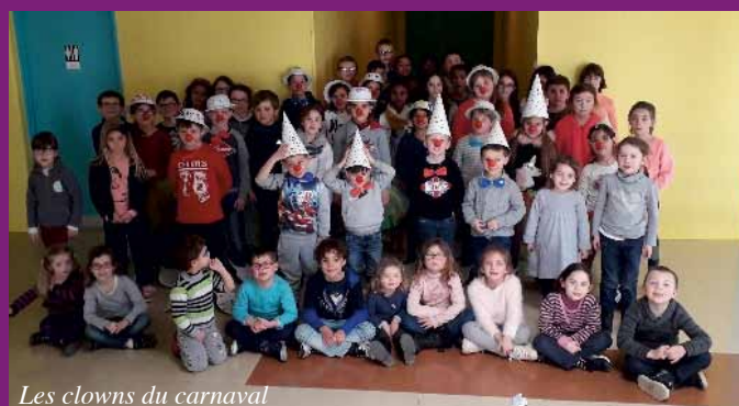
Les clowns du carnaval

Des sorties ont été organisées à chaque vacances scolaires (Cosmorium, cinéma, bowling, château kids, cirque Paradiso, Le Pal, accrobranches, Circus World...) ainsi que deux séjours courts pendant le mois de juillet : un à la base de Bellebouche pour les 7-10 ans avec activités pédalos, mini-golf, baignade et un autre à Chasseneuil du Poitou pour les 11-16 ans avec au programme Water Jump, Laser Game et Karting.