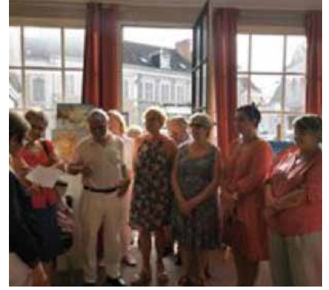
Inauguration d'une exposition de peintures à la Maison de Bois.