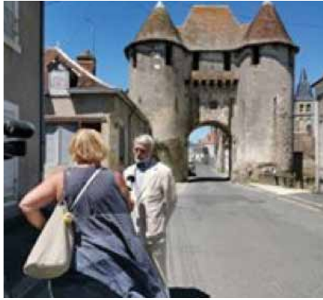
Tournage de France 3 pour la porte de Champagne.