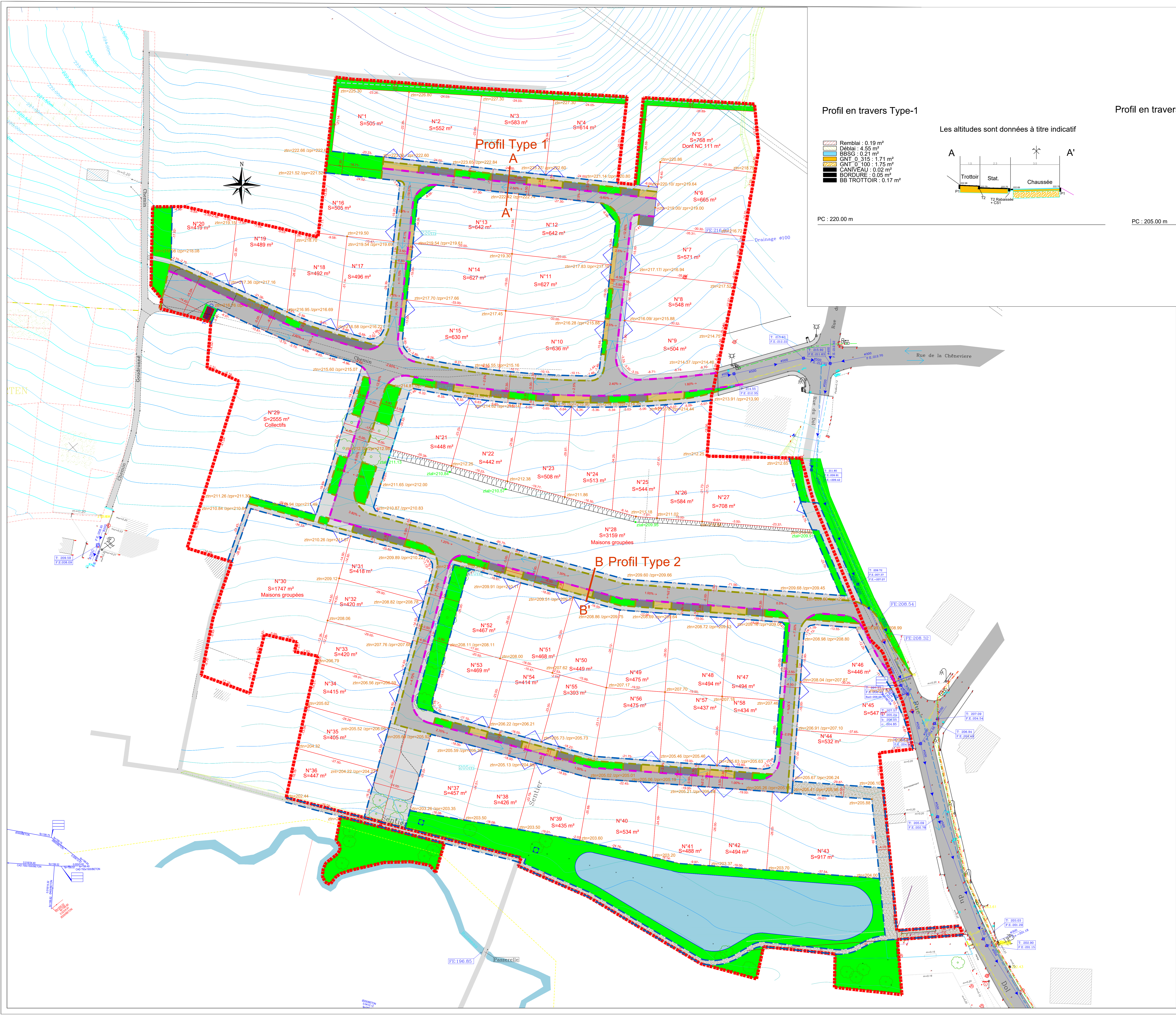
Profil en travers Type-1