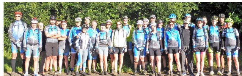
La bande à Gilou