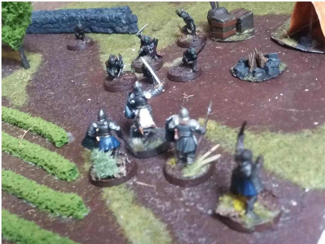
Deux capitaines s'affrontent protégés par leurs guerriers qui rejoignent progressivement la mêlée