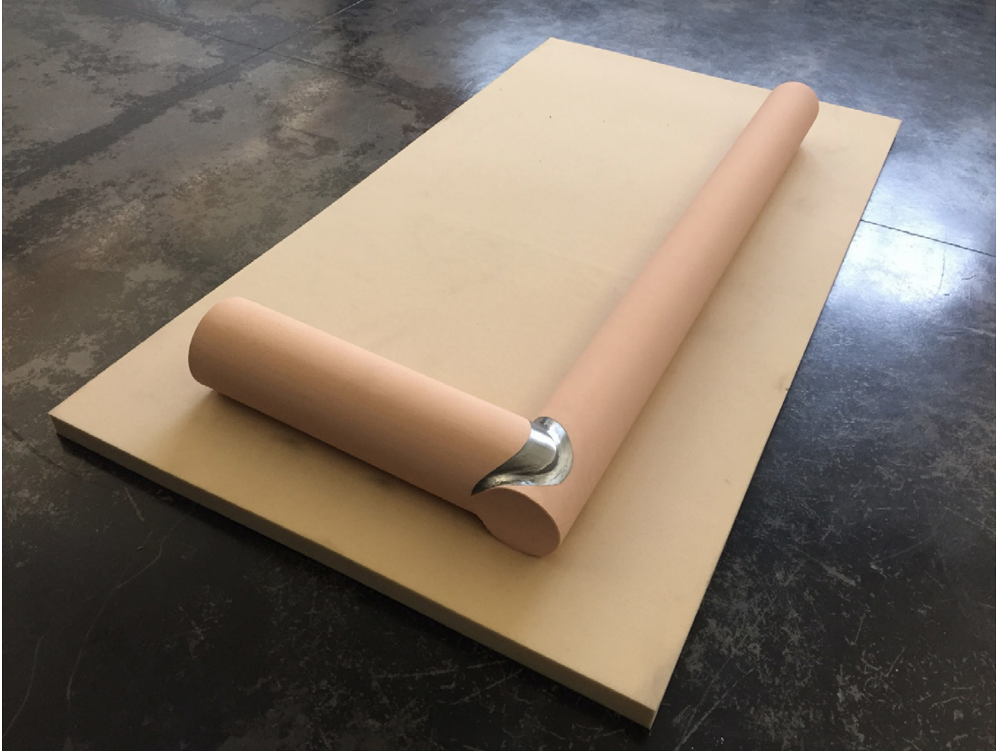
Pierre Weiss, Inclinaison . 2017 Acier, peinture vinylique, mousse compacte 201 x 111 x 20 cm. Unique