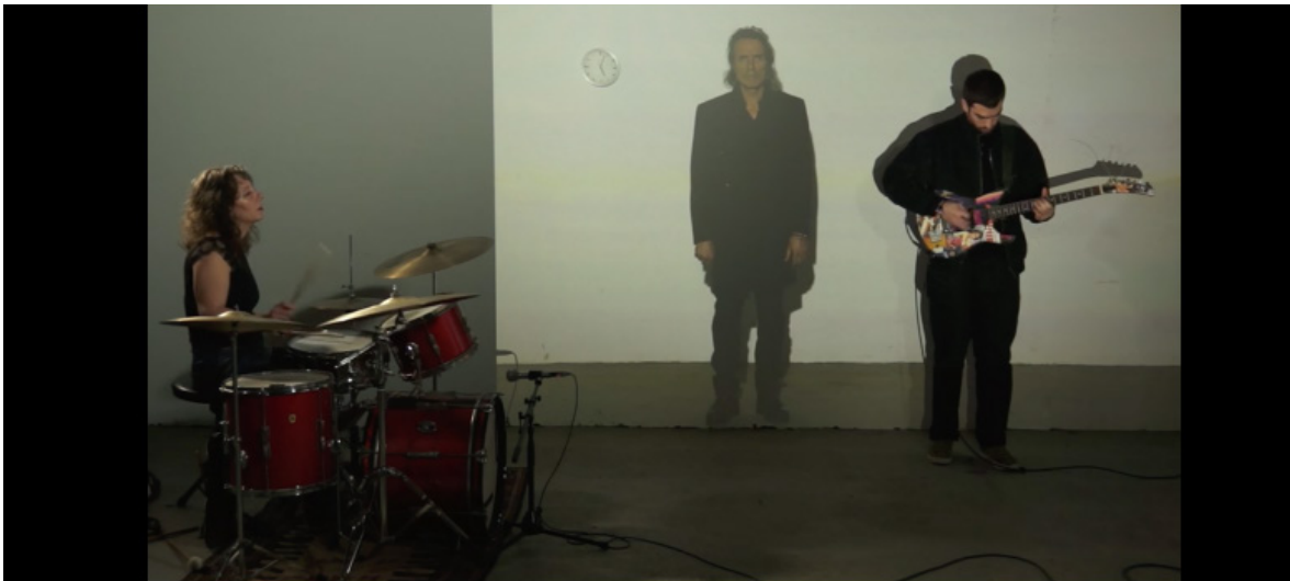
Pierre Weiss, EINDRUCK . (3 personnages, batterie, guitare, projection)., 2018 Son, couleur, 1h4min