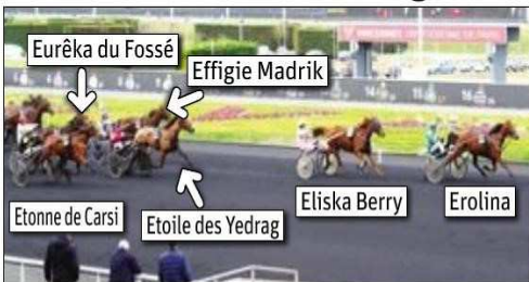
Favorite, Erolina a remporté, samedi, et le tout en six sorties, sa troisième course de l'hiver, ainsi que son deuxième quinté.