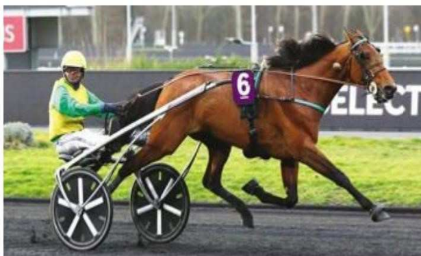
Face Time Bourbon s'impose en authentique champion

Puis le professionnel bordelais est revenu sur le succès de son nouveau prodige, Face Time Bourbon : "Au heat, il avait l'œil d'un gagnant. Il était