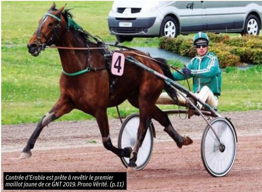
Contrée d'Erable est prête à revêtir le premier maillot jaune de ce GNT 2019. Prono Vérité. (p.11)