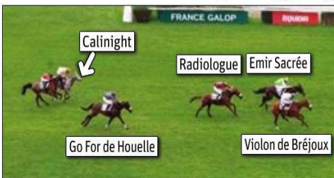
Déjà vainqueur d'un événement à Pau cet hiver, Violon de Bréjoux a doublé la mise, dimanche à Auteuil, en s'adjugeant le Prix Karcimont.