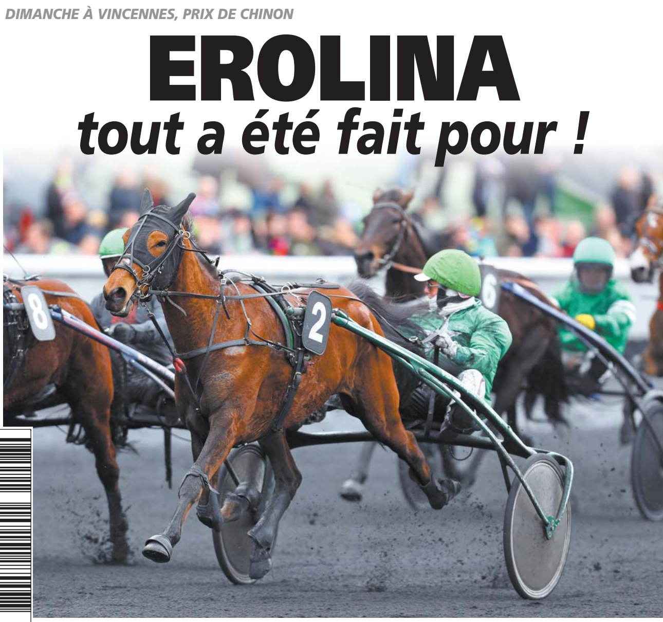
DIMANCHE À VINCENNES, PRIX DE CHINON