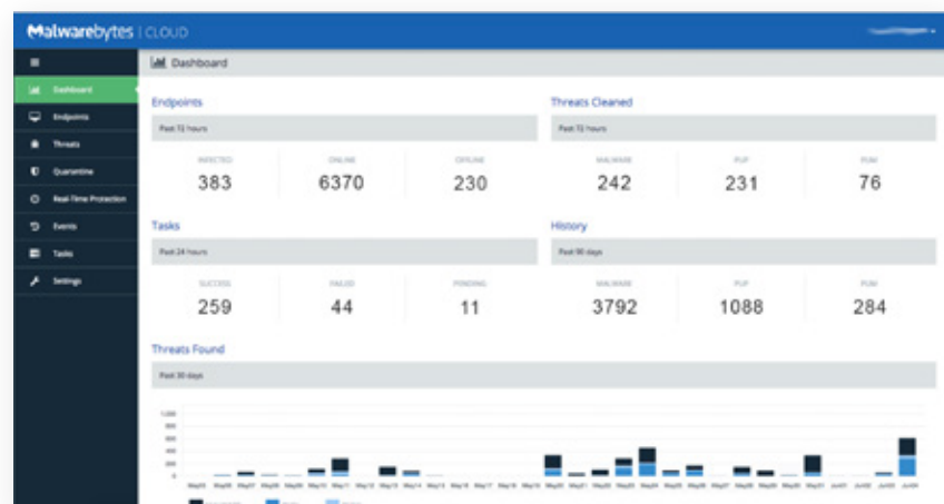
Console cloud Malwarebytes – Tableau de bord

Malwarebytes Incident Response est un outil de détection des menaces et de remédiation qui s'appuie sur une plateforme de gestion hautement évolutive hébergée dans le cloud. Il analyse le réseau de terminaux à la recherche de menaces avancées telles que les malwares, les PUP et les adwares, et les élimine complètement. Malwarebytes Incident Response optimise votre capacité de détection des menaces ainsi que le délai nécessaire pour répondre à une attaque tout en vous offrant les avantages d'une solution évolutive, flexible et automatisée.