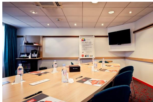
ibis Lyon Est Bron

ibis Lyon Est Bron 36 avenue du doyen Jean Lépine 69500 BRON Tél. : +33 (0) 4.72.13.33.00 Fax : +33 (0) 4.72.33.08.26 E-mail : HO617@ACCOR.COM