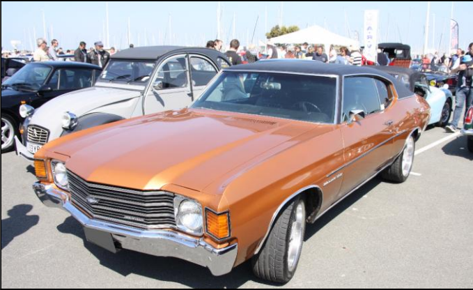
CHEVROLET Chevelle Malibu 350 de 1972