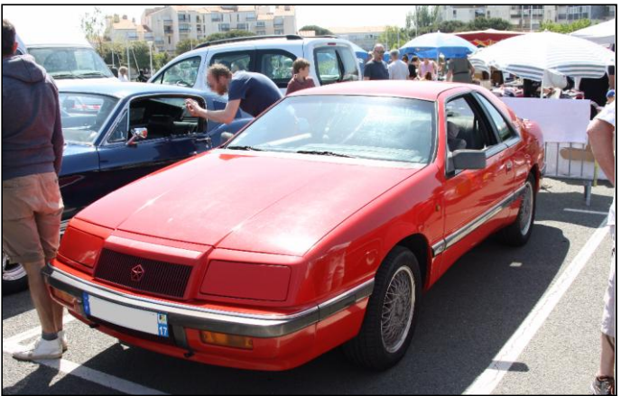
CHRYSLER LE BARON turbo GTC (1986-1995)