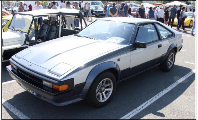
TOYOTA Celica Supra MKII (1981-1986)