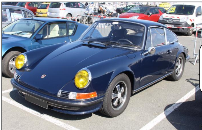
PORSCHE 911 (901) S (1967-1969)