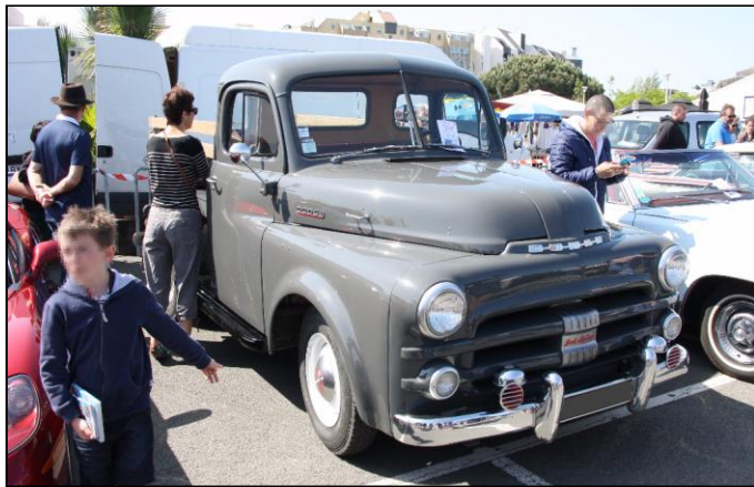
DODGE Job Rated de 1951