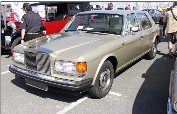
ROLLS ROYCE Silver Spirit de 1985