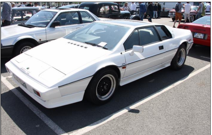
LOTUS Esprit HC de 1987