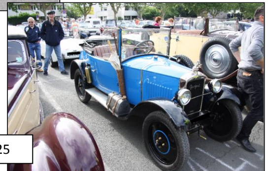
PEUGEOT 172 R de 1925