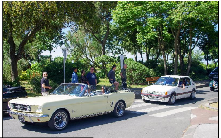
Place du 8 Mai avec vue sur l'Allée du Mail.