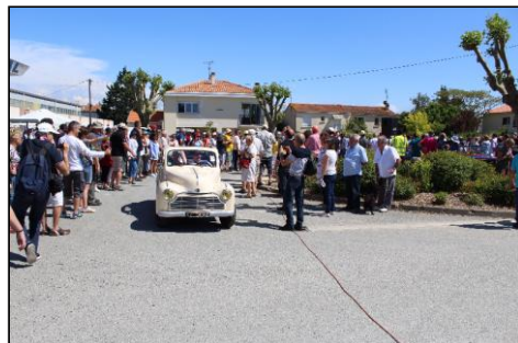
Une partie des participants au concours d'élégance.