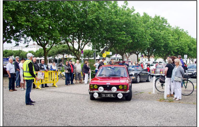
C'est le départ, sortie du parking, direction L' Houmeau en passant par La Pallice.