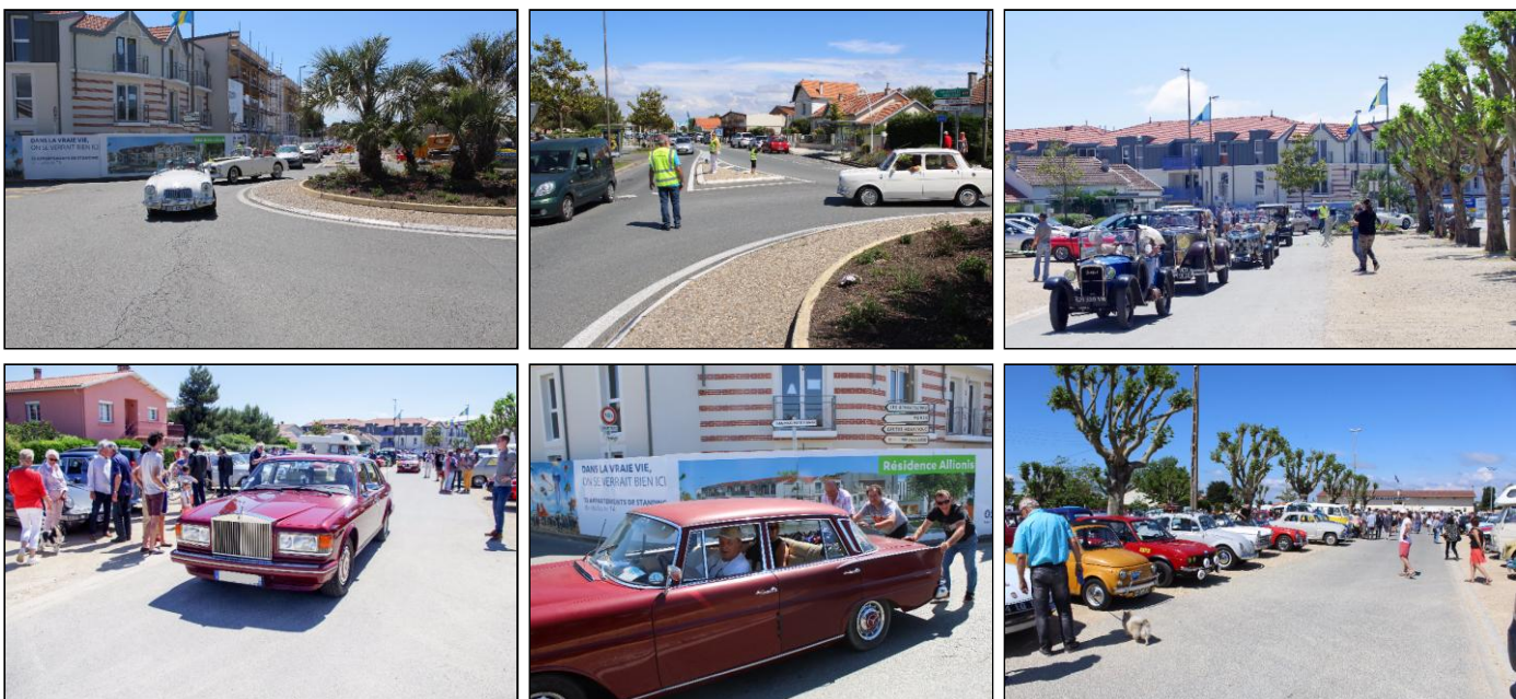
Arrivée au stade, 4 à 6 personnes au rond-point pour entrer au parking. Ah ! Une panne !

Nous continuons le parcours en passant par le port de Châtel et celui des Boucholeurs (un endroit que j'appelle le Petit St Tropez depuis la tempête Xynthia). Après avoir sillonné les Boucholeurs (ex vieux Châtelailon) ainsi que le centre-ville, notre destination était atteinte sur le parking du stade où tous les véhicules ont trouvé place après un accès chargé au rond-point de l'ex gendarmerie.