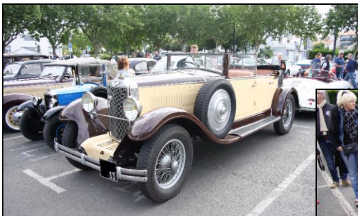
UNIC M3 de 1931 (F)

196 équipages étaient présents avec leurs superbes américaines, les tacots, les populaires et les sportives, dont certaines ont marquées leur passage.