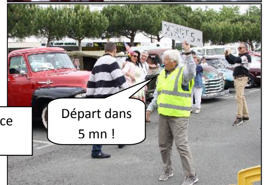
Départ dans 5 mn !