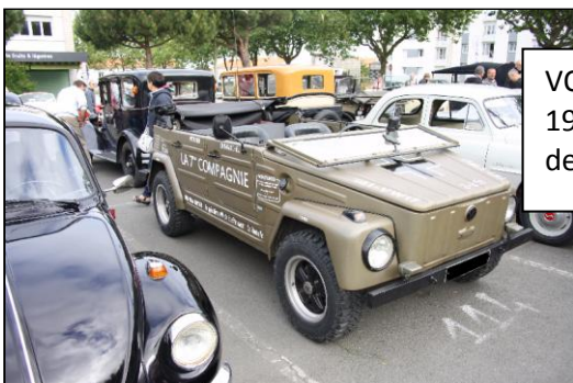
VOLKSWAGEN 181 (1969-1979) aux couleurs de la 7 ème compagnie