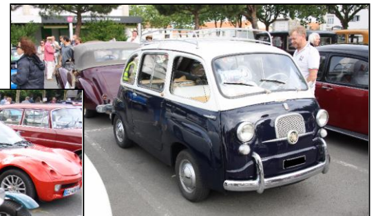
Fiat 600 Multipla (1956-1965) Ancêtre du monospace (I)