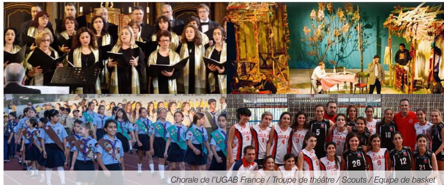
Chorale de l'UGAB France / Troupe de théâtre / Scouts / Equipe de basket

En plus des cours de langue, elle propose aussi des cours de culture et d'histoire.