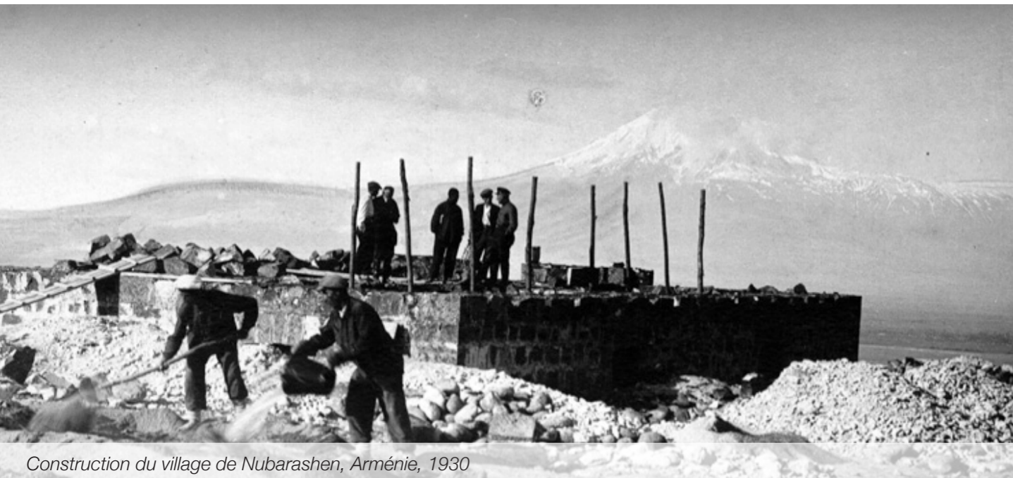
Construction du village de Nubarashen, Arménie, 1930