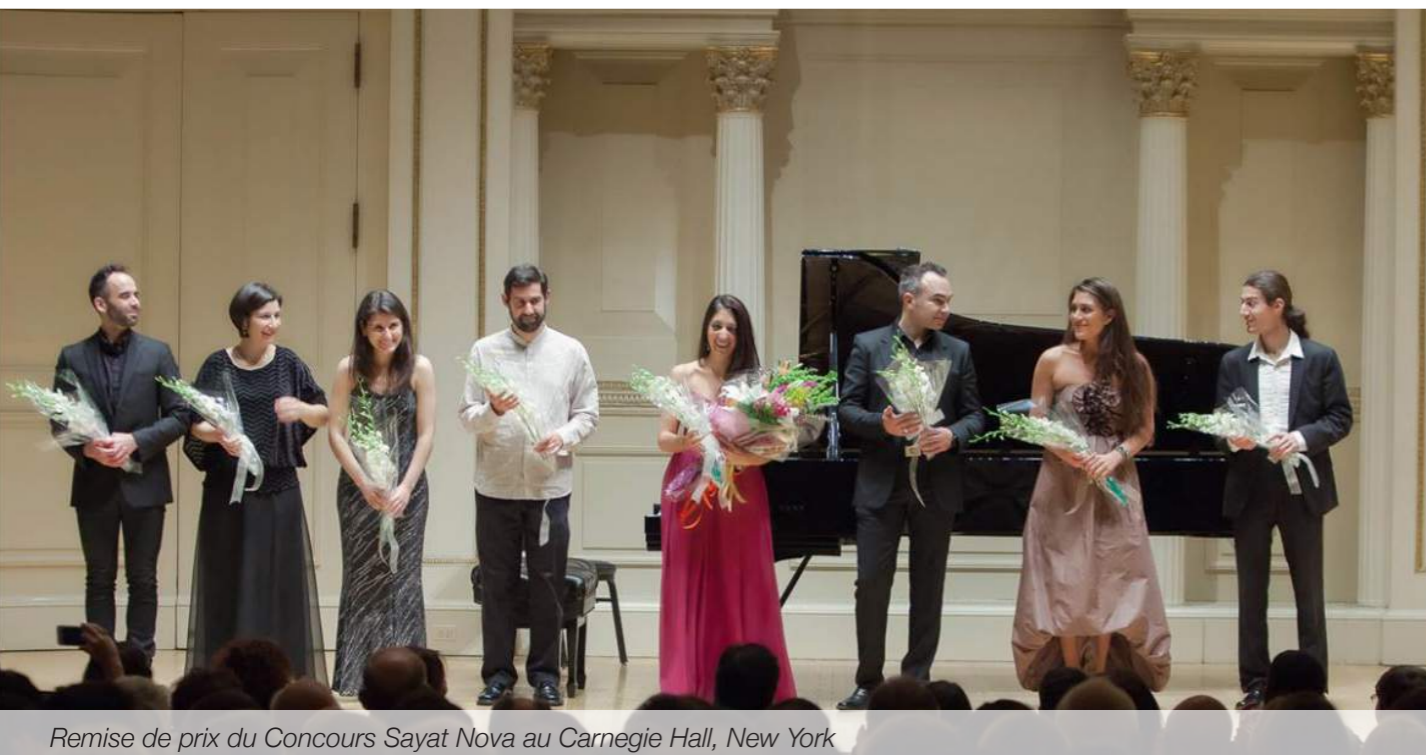
Remise de prix du Concours Sayat Nova au Carnegie Hall, New York