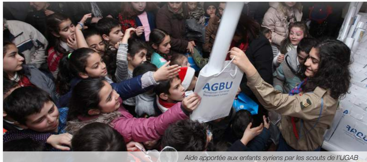
Aide apportée aux enfants syriens par les scouts de l'UGAB

Face à la terrible réalité, la diaspora arménienne se mobilise.