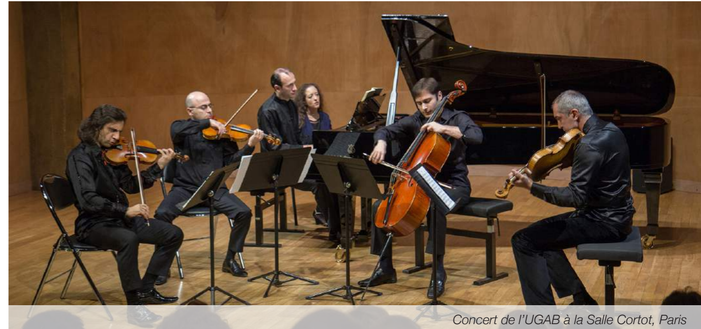
Concert de l'UGAB à la Salle Cortot, Paris

A terme, le Département envisage de mettre en place des programmes de parrainage entre mécènes et jeunes artistes.