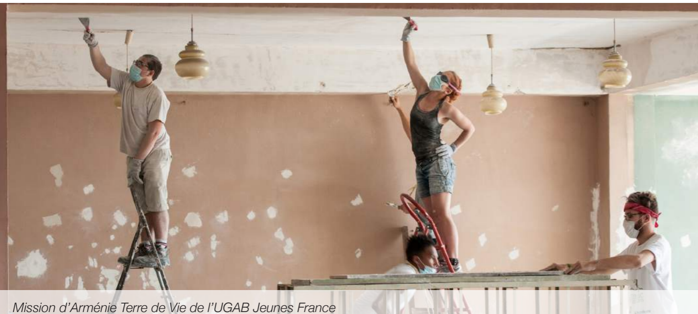
Mission d'Arménie Terre de Vie de l'UGAB Jeunes France