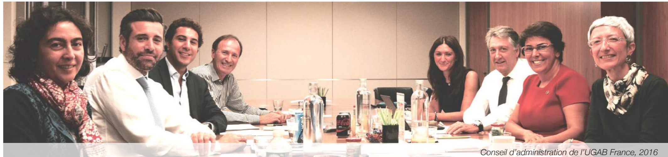
Conseil d'administration de l'UGAB France, 2016

L'Union organise et coordonne à l'échelle mondiale une aide humanitaire d'urgence pour les populations menacées.