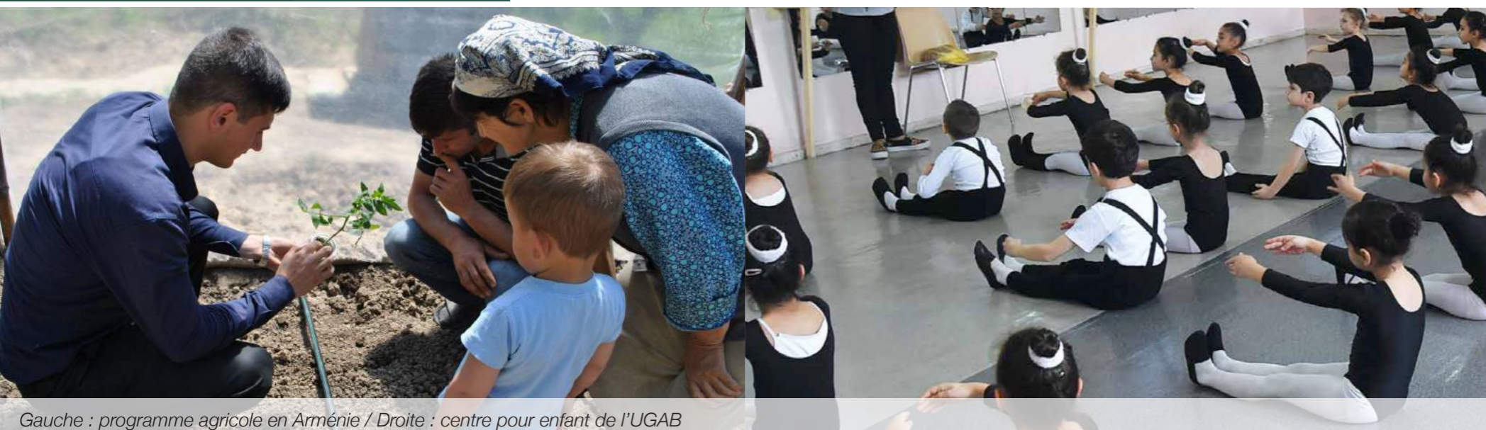
Gauche : programme agricole en Arménie / Droite : centre pour enfant de l'UGAB

Des centres Tumo ont d'ores et déjà vu le jour dans les villes de Gyumri et Dilidjan grâce au financement de l'Union.