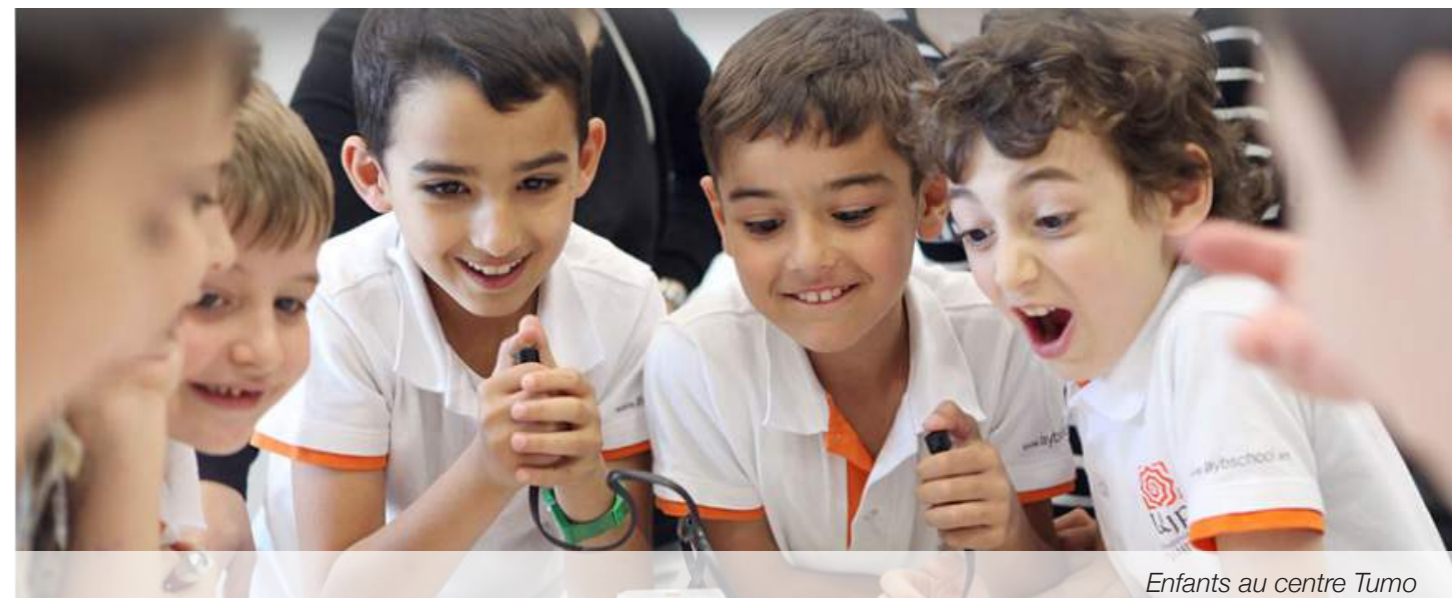
Enfants au centre Tumo

L'UGAB est l'un des acteurs les plus importants dans le développement du pays.