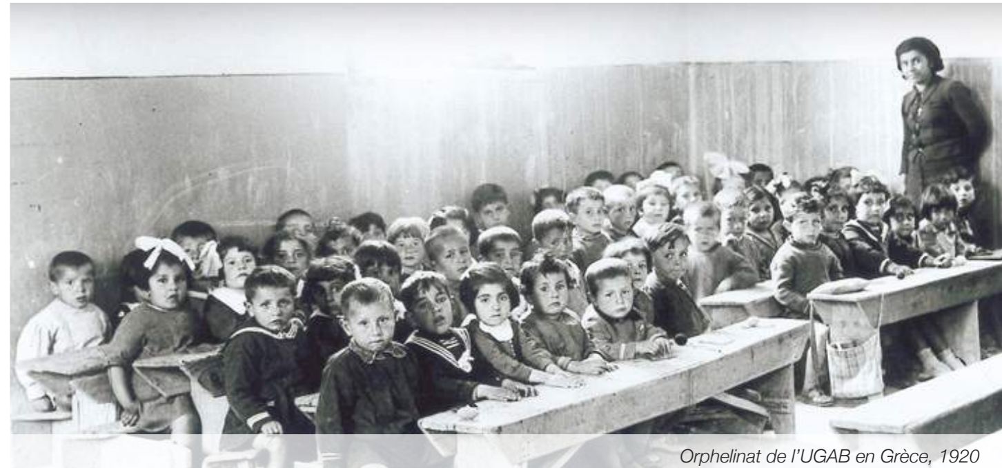
Orphelinat de l'UGAB en Grèce, 1920

Le génocide de 1915, perpétré par l'Empire ottoman marque un tournant dans l'histoire du peuple arménien.