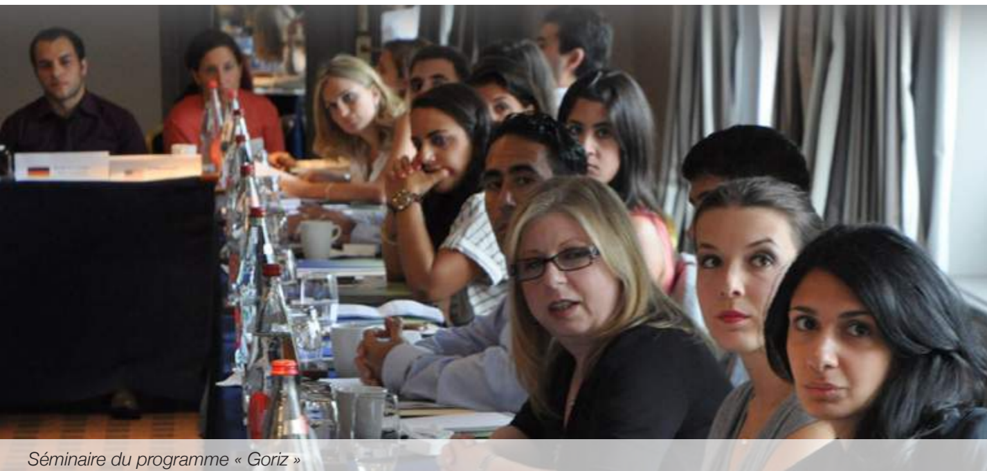
Séminaire du programme « Goriz »