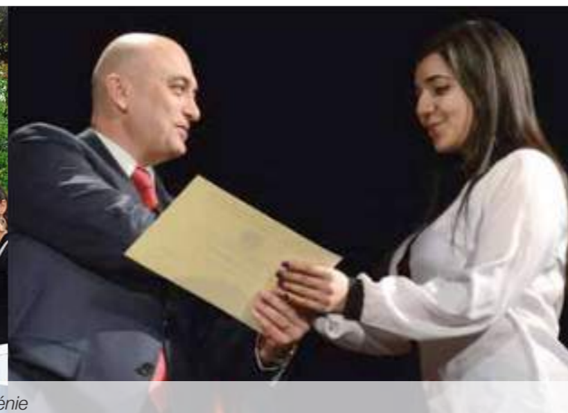
Gauche : réunion de Young Professionals à Paris / Droite : remise de bourse à l'Université Française en Arménie