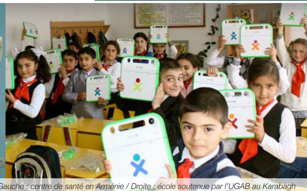
Gauche : centre de santé en Arménie / Droite : école soutenue par l'UGAB au Karabagh