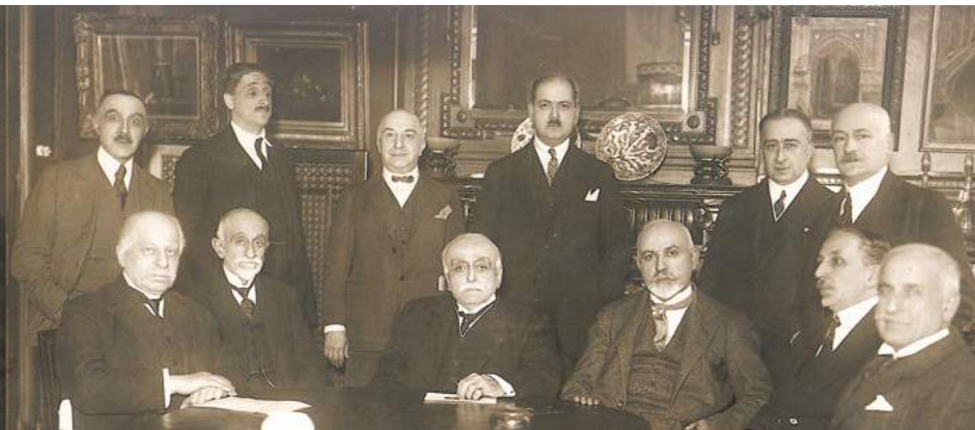
Gauche : Nubar Pacha, fondateur / Droite : première photo du conseil d'administration, Paris 1925