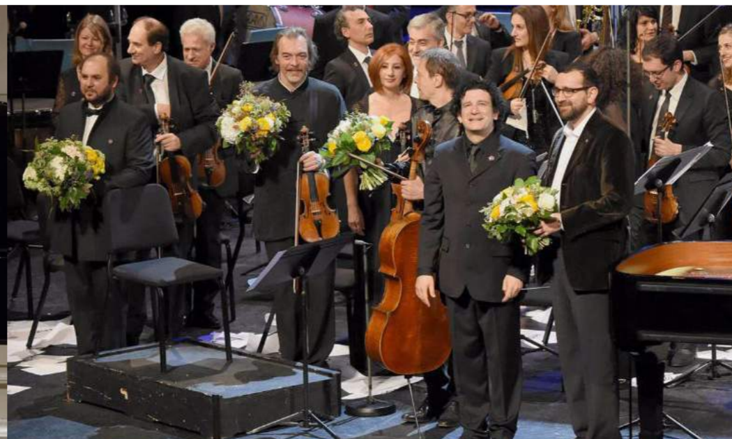
Gauche : concert au Carnegie Hall, New York / Droite : concert du centenaire du génocide au Théâtre du Châtelet, Paris