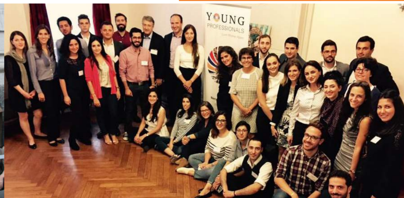
Gauche : séminaire du programme « Goriz » / Droite : réunion des Young Professionals à Londres, 2016

Des séminaires et rencontres s'organisent également entre YP européens ou du monde entier.