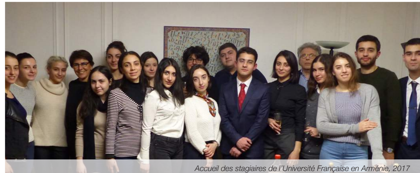
Accueil des stagiaires de l'Université Française en Arménie, 2017

Les critères de sélection des boursiers tiennent compte de leur filière d'étude, de leurs parcours et de leur situation financière.