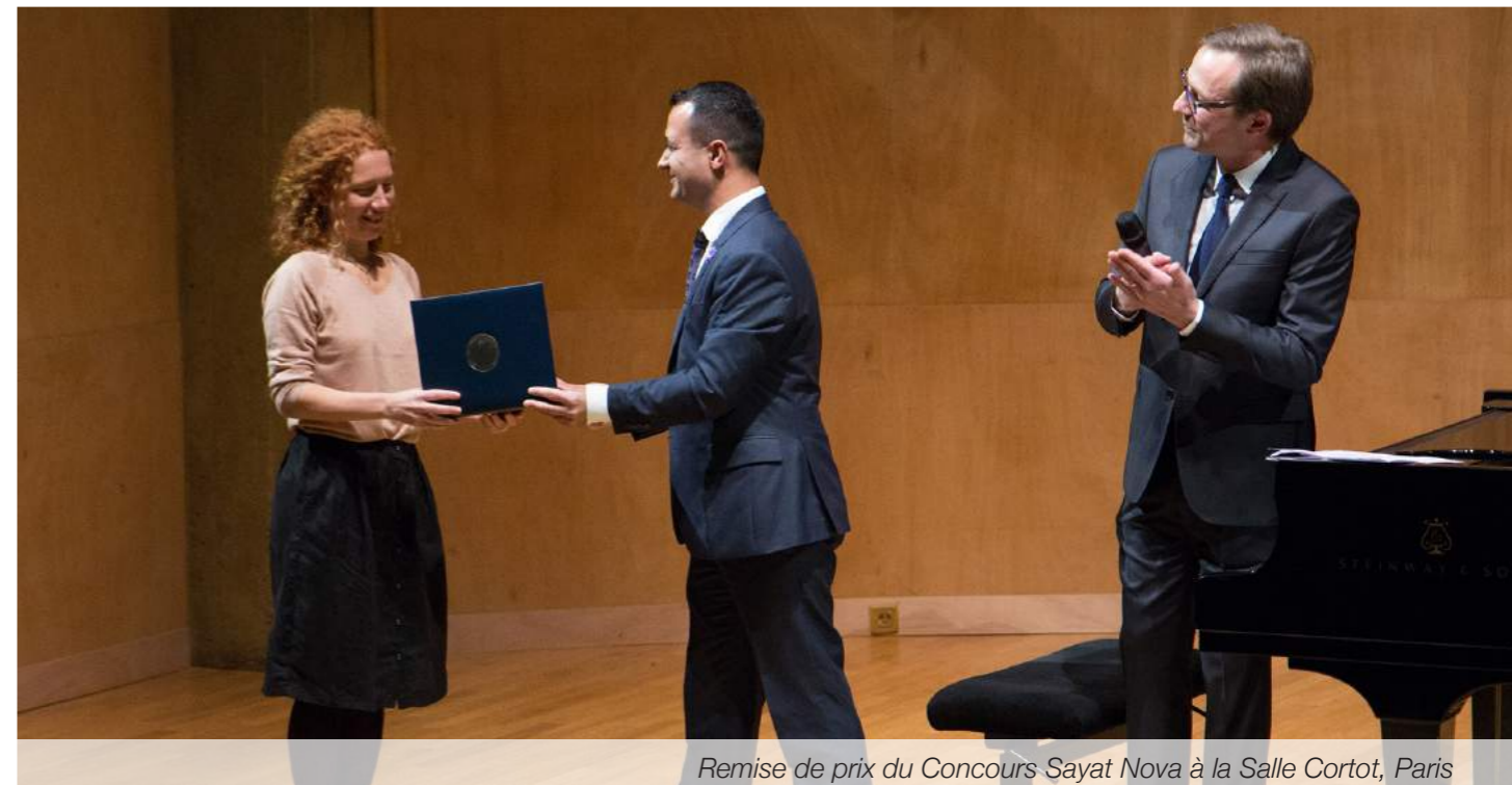
Remise de prix du Concours Sayat Nova à la Salle Cortot, Paris

L'UGAB leur offre en outre la possibilité de voir leurs oeuvres publiées.