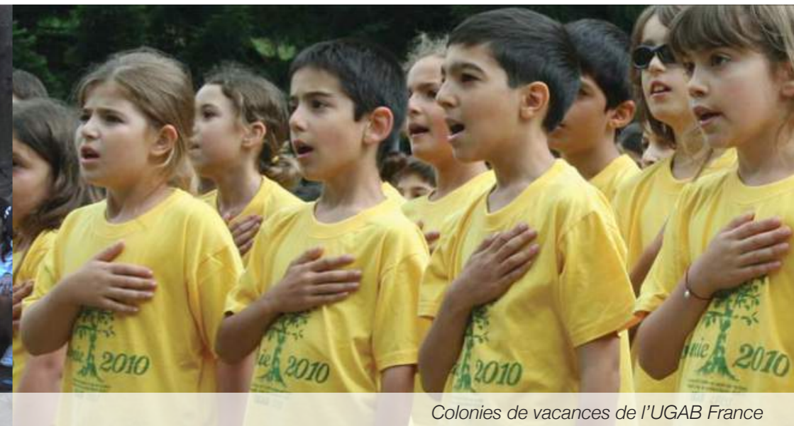
Colonies de vacances de l'UGAB France