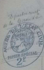
Table Décennale des actes de Mariages de la commune de Saint André de Cubzac du 1 er janvier 1913 au 31 décembre 1922, dressée en exécution du décret du 27 janvier 1913 (1913 à 1922)