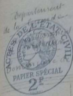
Table décennale des actes de Mariages de la commune de Saint André de Cubzac du 1 er Janvier 1913 au 31 Décembre 1922, dressée en vertu du décret du 27 janvier 1913 (1913 à 1922)

de la commune de Saint André de Cubzac 1 er Janvier 1913 au 31 décembre 1922, dressée en vertu du décret du 27 janvier 1913 (1913 à 1922)