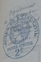
Table Décennale des actes de Mariages de la commune de Saint-André-de-Cubzac du 1 er janvier 1913 au 31 décembre 1922, dressée en exécution du décret du 27 février 1913 (1913 à 1922)