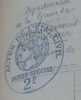
Table Décennale des actes de Mariages de la commune de Saint André de Cubzac 1 er janvier 1913 au 31 décembre 1922, dressée en exécution du décret du 27 janvier 1913 (1913 à 1922)