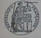
TABLE DÉCENNALE des actes de Mariages de la commune de St André de Cubzac du 1 er Janvier 1903 au 31 Décembre 1912, dressée en exécution du Décret du 27 Février 1913 (1903 à 1912).

COMMUNE de St André de Cubzac Département de la Gironde ARRONDISSEMENT DE BORDEAUX