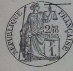
TABLE DÉCENNALE des actes de Mariages de la commune de S t André de Cubzac du 1 er Janvier 1903 au 31 Décembre 1912, dressée en exécution du Décret du 27 Février 1913 (1903 à 1912).

COMMUNE de S t André de Cubzac Département de la Gironde ARRONDISSEMENT DE BORDEAUX