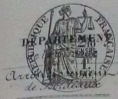
TABLE DÉCENNALE des actes de Mariages de la commune de St André de Gubze du 1 er Janvier 1883 au 31 Décembre 1892 dressée en exécution du décret du 20 Juillet 1807 (1883 à 1892)