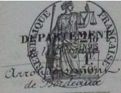
TABLE DÉCENNALE des actes de Naissances de la commune de St André de Cubzac du 1 er Janvier 1883 au 31 Décembre 1892 dressée en exécution du décret du 20 Juillet 1807 (1883 à 1892)