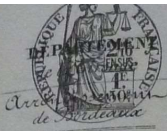
TABLE DÉCENNALE des actes des Mariages

de la commune de St André de Cubzac du 1 er Janvier 1883 au 31 Décembre 1892 dressée en exécution du décret du 20 Juillet 1807 (1883 à 1892)