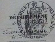
TABLE DÉCENNALE des actes de Mariages

de la commune de St André de Cubzac du 1 er Janvier 1883 au 31 Décembre 1892 dressée en exécution du décret du 20 Juillet 1807 (1883 à 1892)